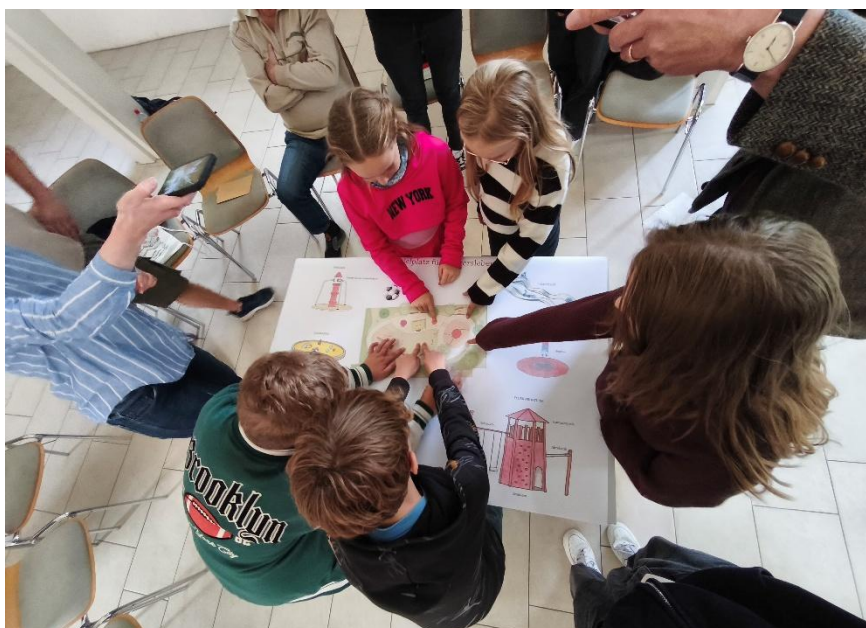
Abbildung 3 Zweite Sitzung am 23. September in der St. Nikolai Kirche

Am 21. August 2025 fand vor Ort in Waltersleben die erste lokale Beteiligungsrunde mit den Kindern statt. Dabei hatten sie die Möglichkeit, direkt auf dem Plan ihre Ideen, Wünsche und Anmerkungen zu verorten. Viele Kinder nutzten diese Gelegenheit, um Feedback zu den geplanten Spiel- und Aufenthaltsbereichen zu geben und eigene Vorschläge einzubringen. Dieses direkte Mitwirken trug dazu bei, den Entwurf aus der Perspektive der zukünftigen Nutzer weiter zu schärfen und die Gestaltung noch stärker auf ihre Bedürfnisse abzustimmen.