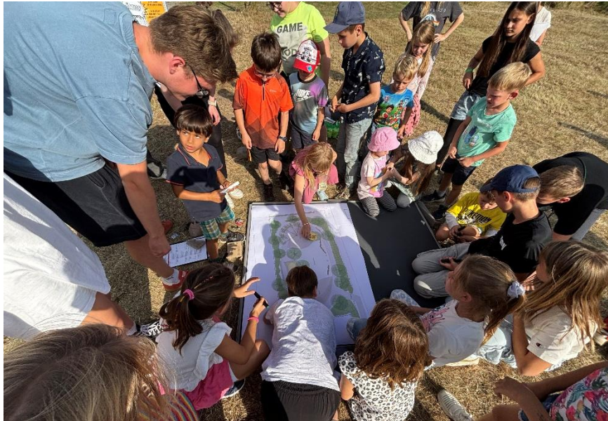
Abbildung 2 Ortsbesprechung am 21. August 2025

Am 21. August 2025 fand vor Ort in Waltersleben die erste lokale Beteiligungsrunde mit den Kindern statt. Dabei hatten sie die Möglichkeit, direkt auf dem Plan ihre Ideen, Wünsche und Anmerkungen zu verorten. Viele Kinder nutzten diese Gelegenheit, um Feedback zu den geplanten Spiel- und Aufenthaltsbereichen zu geben und eigene Vorschläge einzubringen. Dieses direkte Mitwirken trug dazu bei, den Entwurf aus der Perspektive der zukünftigen Nutzer weiter zu schärfen und die Gestaltung noch stärker auf ihre Bedürfnisse abzustimmen.