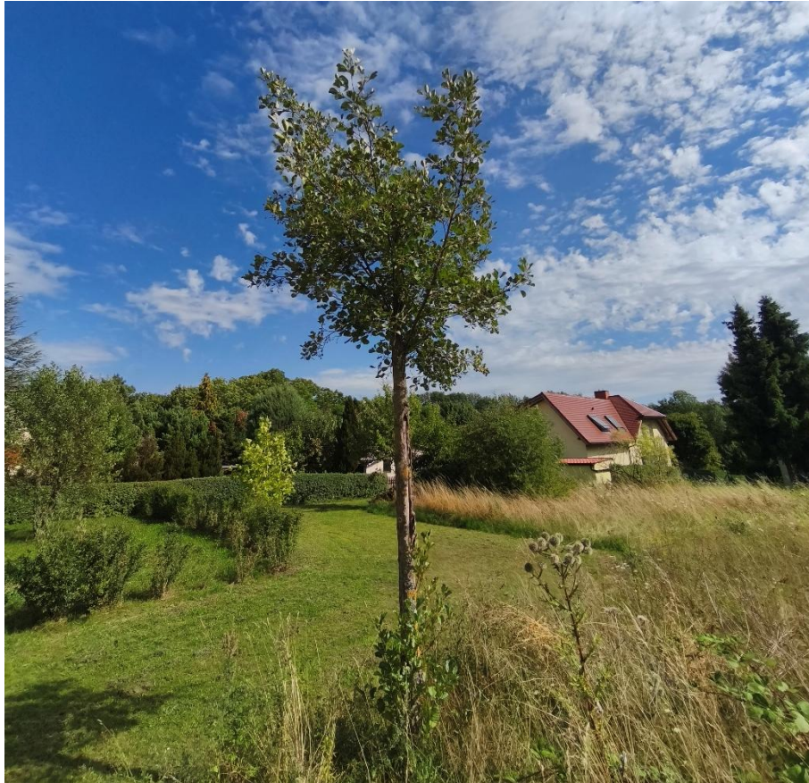
Abbildung 4 Alnus spaethii mit getrenntem Leittrieb

Die im Jahr 2013 gepflanzten Bäume am nördlichen Rand der Fläche befinden sich insgesamt in einem befriedigenden Zustand, ihre Vitalität wurde mit der Stufe 4 bewertet. Der mittlere Bestandsbaum ( Alnus spaethii ) weist am Leittrieb deutliche Schäden auf und hat in 1m Höhe jedoch weitere Triebe. Hier soll der Baum aufgrund dessen stark gekürzt, aber nicht gefällt werden. Im Zusammenhalt ist es in der bestehenden Baumreihe vorgesehen einen weiteren Baum zu pflanzen, um den räumlichen Zusammenhang und die gestalterische Kontinuität zu erhalten und um eine ausreichende Beschattung für die Kinder zu gewährleisten. Die Ruderalvegetation auf den Erdwällen bleibt erhalten und wird durch 5 Neupflanzungen ergänzt. Somit werden drei Bestandsbäume erhalten, eine Ersatzpflanzung vorgenommen und sieben weitere Bäume neu gepflanzt. Sämtliche Hecken und Strauchgewächse, als auch die Bestandsbäume werden während der gesamten Bauzeit geschützt.