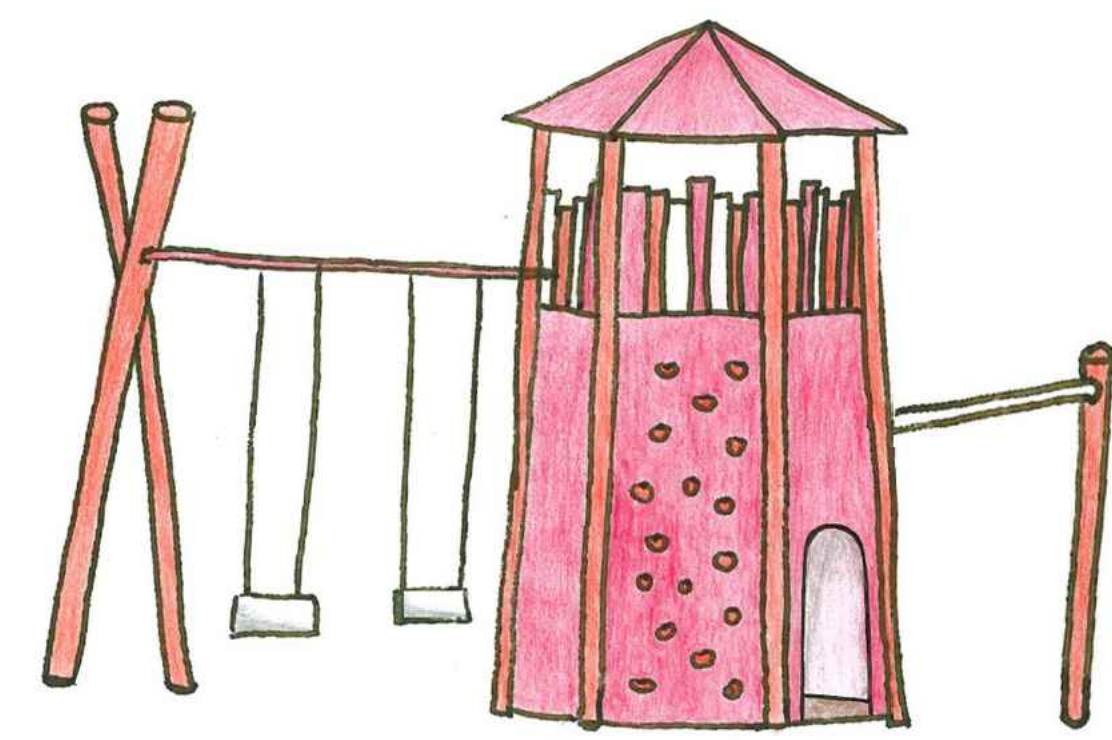
Skizze Spielgerät Feuerwehrturm