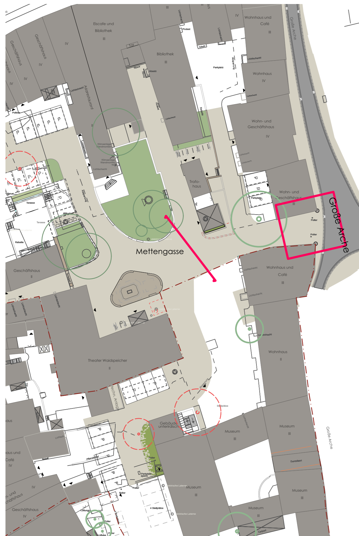
Übersichtsplan M 1:500