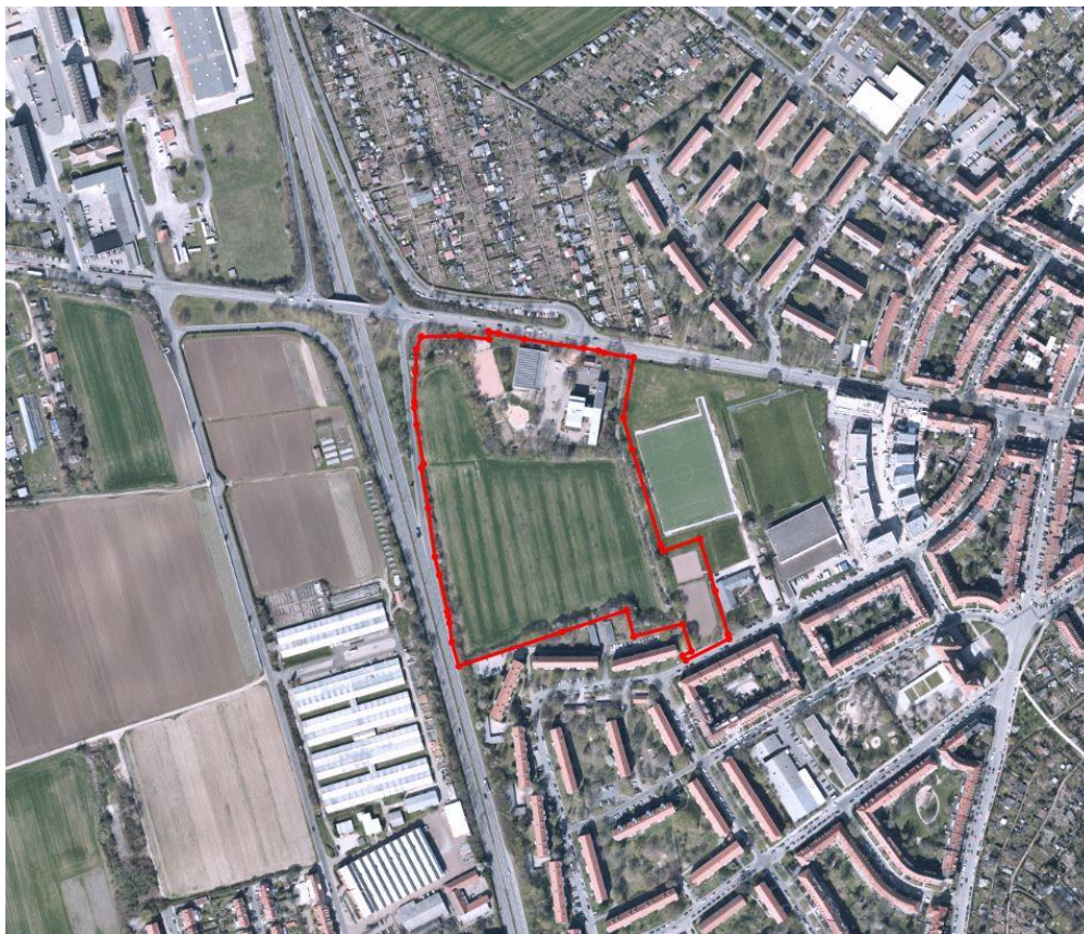
Luftbild Umgriff Planungsgebiet