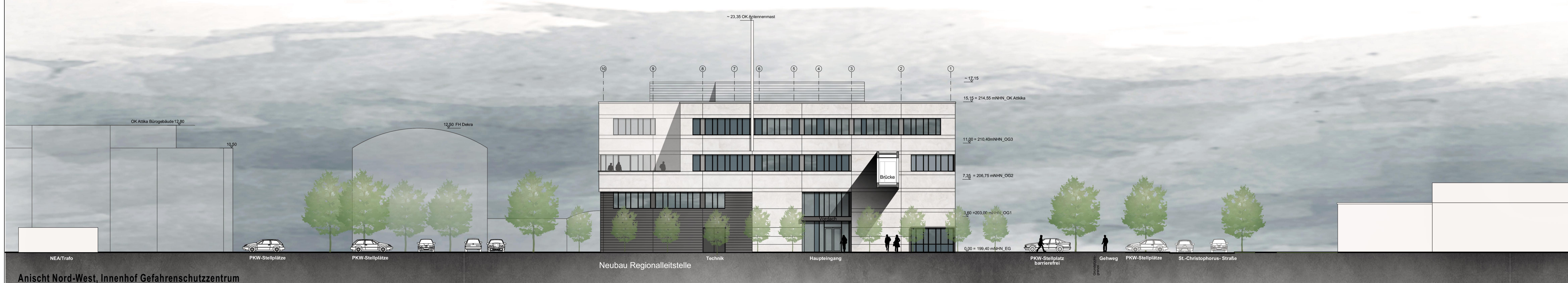
Anischt Nord-West, Innenhof Gefahrenschutzzentrum