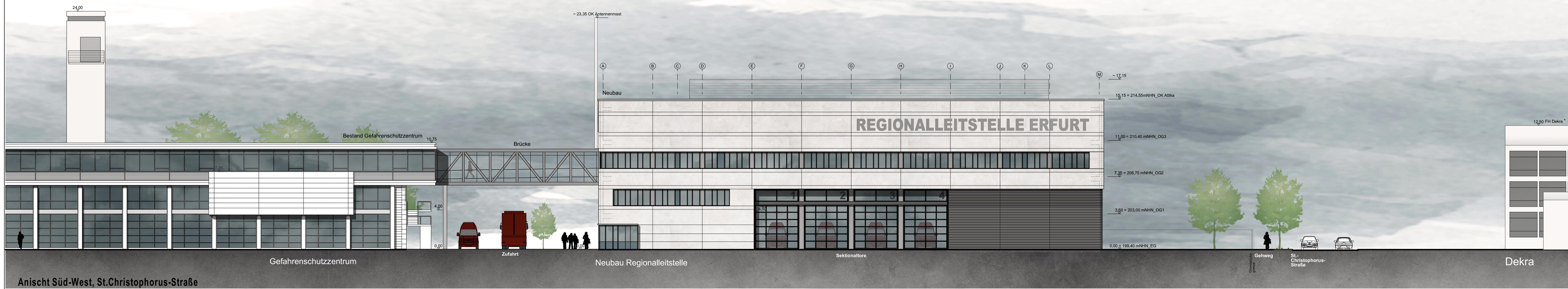
Anischt Süd-West, St.Christophorus-Straße