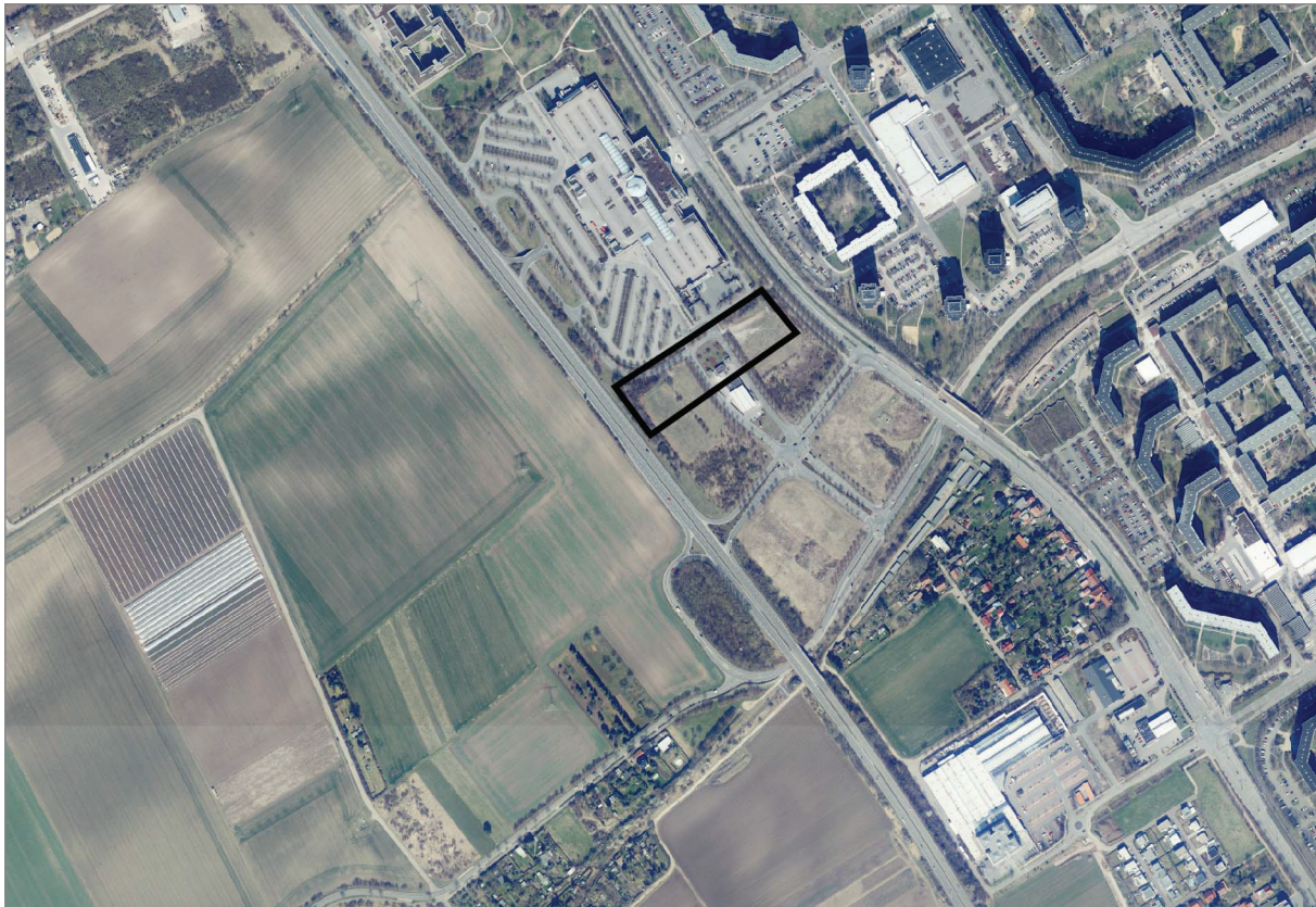
Abbildung 2 - Luftbild M 1 :10.000, Stand: 10.05.2016, mit schematischer Darstellung des Geltungsbereiches der 44. Änderung des FNP

Für den KFZ- Verkehr ist das Plangebiet sowohl aus dem Stadtgebiet wie auch über das überörtliche Verkehrsnetz gut zu erreichen. Durch die Dubliner Straße ist es über die Lissabonner Straße an das bestehende Hauptstraßennetz angebunden. Im Umfeld des Plangebietes ist der ÖPNV mit Straßenbahn und Bus in fußläufiger Entfernung gut erreichbar.