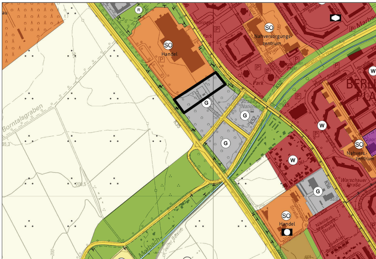
Abbildung 1 – Auszug Neubekanntmachung des Flächennutzungsplanes der Stadt Erfurt vom 14.07.2017

Der Geltungsbereich der 44. Änderung des Flächennutzungsplanes umfasst eine Fläche von rund 1,5 ha, welche im wirksamen FNP vollständig als gewerbliche Baufläche dargestellt ist. Maßgeblich ist die Planzeichnung zur FNP-Änderung.