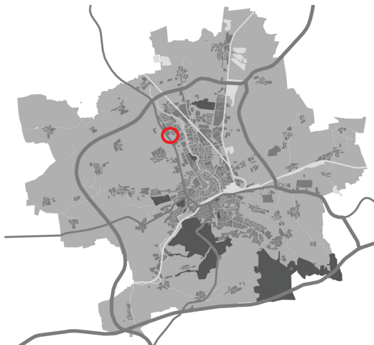
Abbildung 1 - Schemakarte zur Lage im Stadtgebiet

Das Plangebiet befindet sich im Norden des Stadtgebietes von Erfurt im Ortsteil Gispersleben. Der Bereich der 44. Änderung des FNP betrifft eine Fläche von rund 1,5 ha nördlich der Erfurter Innenstadt im Stadtteil Gispersleben. Die mittlere Entfernung zum Stadtzentrum/ Anger beträgt ca. 4.400 m, zum Domplatz ca. 3.800 m.