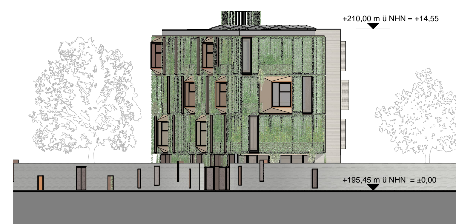
Ansicht Süd-Ost | M 1:200