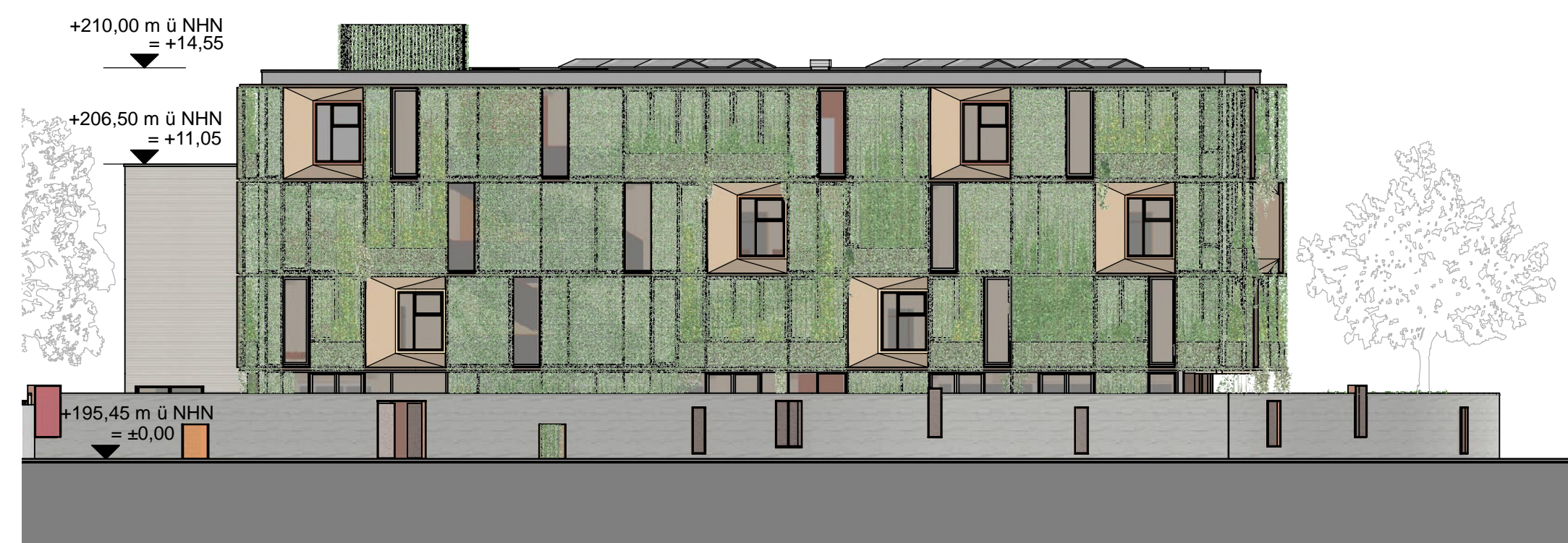
Ansicht Süd-West | M 1:200