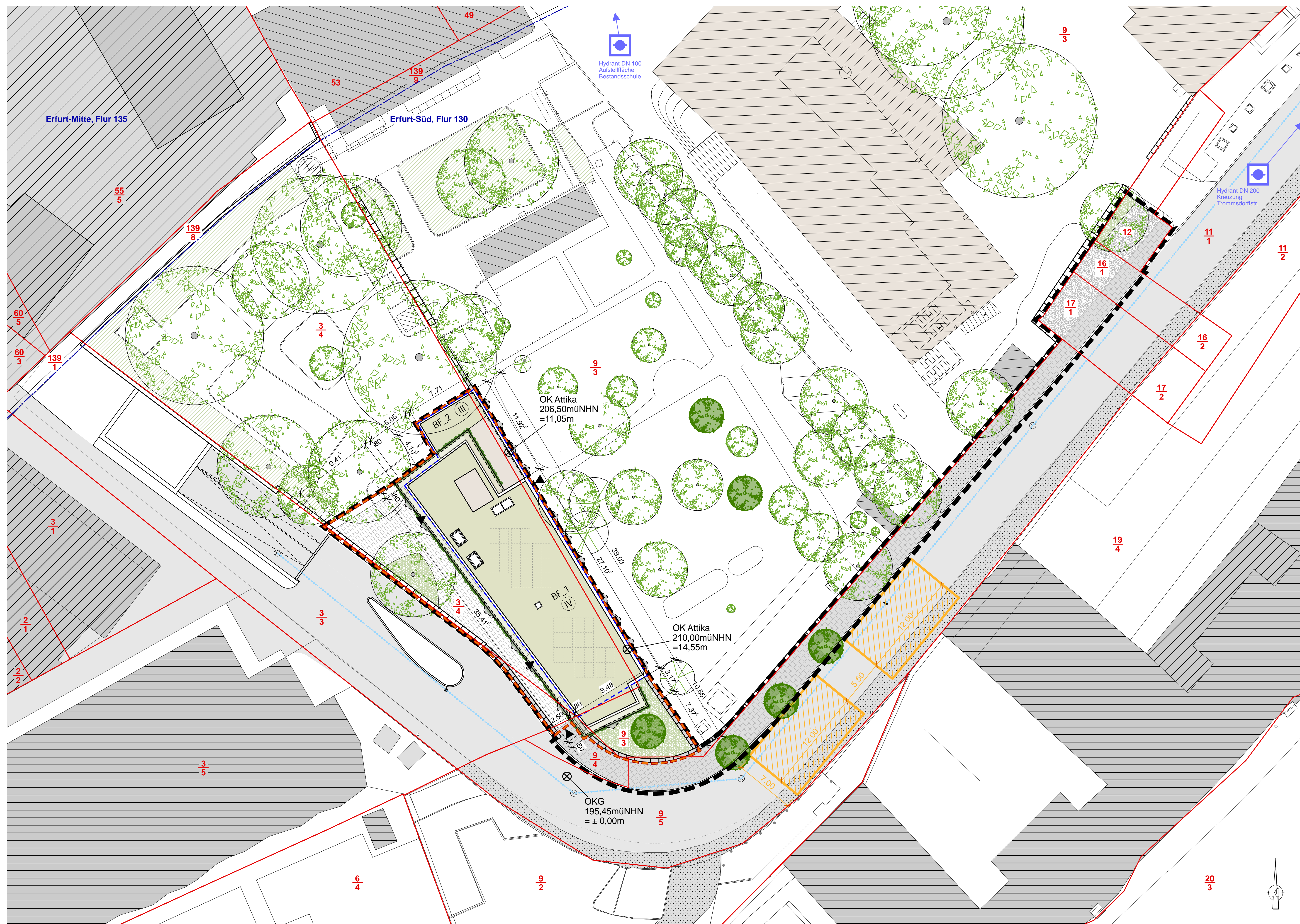
Lageplan | M 1:200