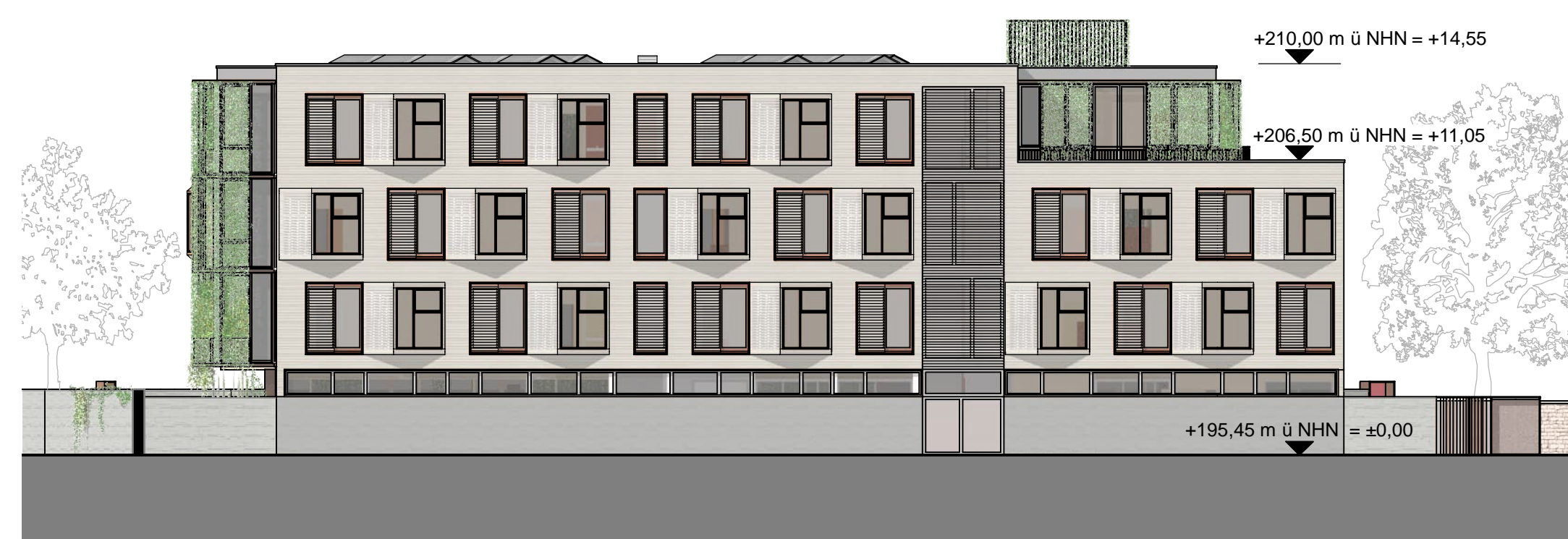
Ansicht Nord-Ost | M 1:200