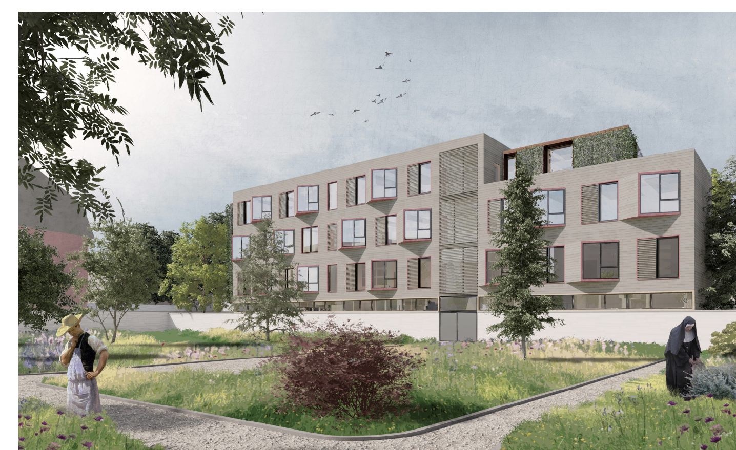
Perspektive | Klostergarten