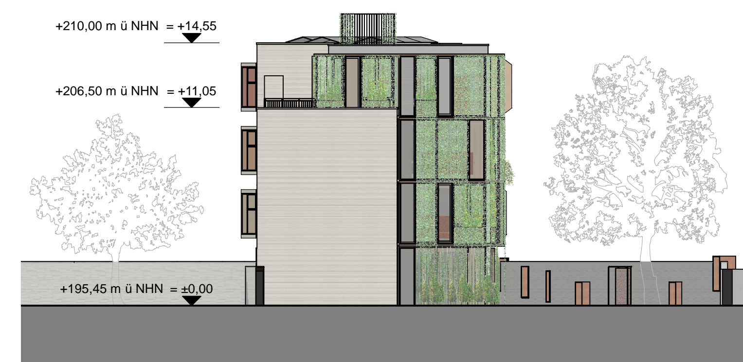
Ansicht Nord-West | M 1:200