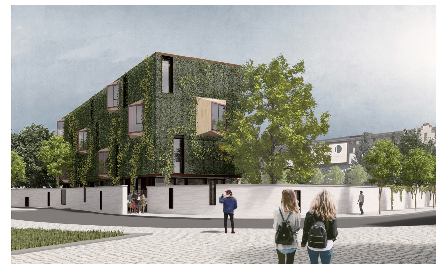
Perspektive | Straßenseite Reglermuer