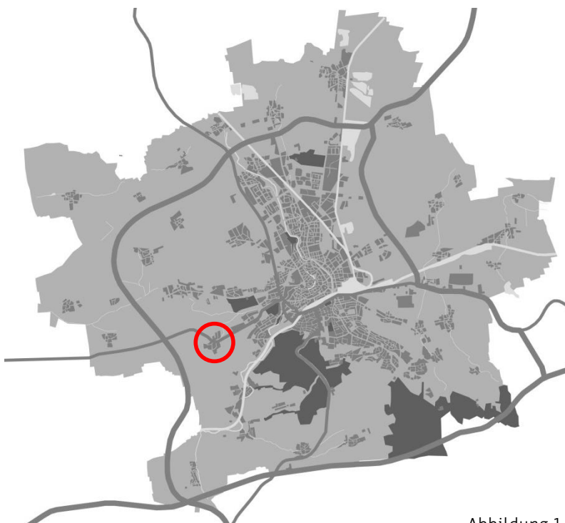
Abbildung 1 – Schemakarte zur Lage im Stadtgebiet

Der Änderungsbereich liegt im Bereich des Ortsteils Schmira und umfasst einen großen und drei kleinere Teilbereiche: Den Teilbereich 1 mit dem westlichen und nördlichen Orts- teilrand im Bereich Am Knotenberg bis zur Frienstedter Straße einschließlich der ehemali- gen Stallanlagen westlich der Frienstedter Straße im Norden Schmiras sowie Flächen am östlichen Ortsteileingang südlich an der Eisenacher Straße, den Teilbereich 2 Südlich Im Brühl mit Gartenflächen, den Teilbereich 3 Südlich Kornweg ebenfalls mit Gartenflächen und Einfamilienhausbebauung, sowie zum Entwurf neu den Teilbereich 4 Südlich See- straße mit Garten- und Landwirtschaftsfläche.