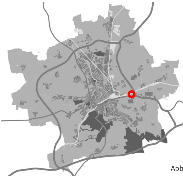
Abbildung 1 - Schemakarte zur Lage im Stadtgebiet

Maßgeblich für den Änderungsbereich ist die Planzeichnung zur Änderung.