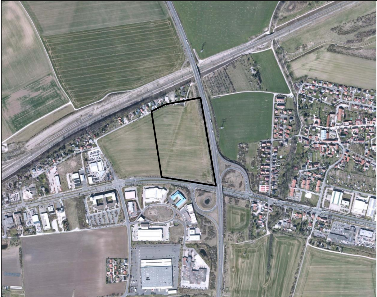
Abbildung 2 – Luftbild (unmaßstäblich)

bauung und die Eisenbahntrasse Halle (Saale) Hbf – Guntershausen. Daran schließen landwirtschaftlich genutzte Flächen an. Im Bereich östlich des Plangebietes befinden sich anschließend an die Konrad-Adenauer-Straße weitere landwirtschaftlich genutzte Flächen und Grünflächen. Darauf folgen die Ortslage von Linderbach und großflächige Einzelhandelsnutzungen. Im Bereich westlich des Plangebietes befinden sich landwirtschaftliche Flächen, an die sich an der Straße An der Henne ein Gewerbegebiet anschließt. Südlich des Plangebietes befindet sich an der Weimarischen Straße ebenfalls ein Gewerbegebiet.