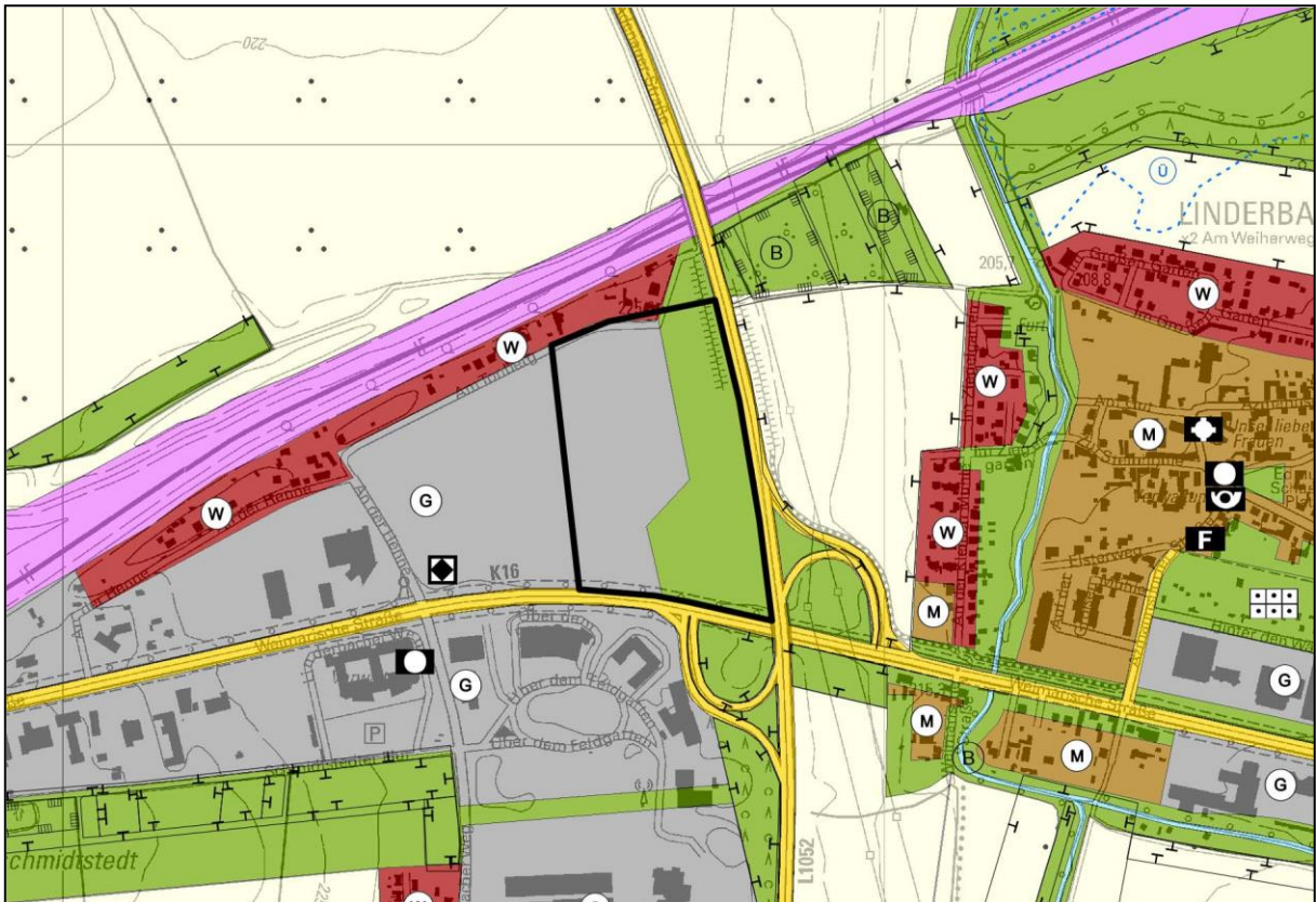
Abbildung 3- Auszug Neubekanntmachung des Flächennutzungsplanes der Stadt Erfurt vom 14.07.2017, M 1:10.000, Stand 06.01.2022

Der Geltungsbereich der 34. Änderung umfasst eine Fläche von rd. 7,7 ha, welche im wirksamen FNP überwiegend als gewerbliche Baufläche und teilweise als Grünfläche dargestellt ist. (Maßgeblich ist die Planzeichnung zur FNP-Änderung.)