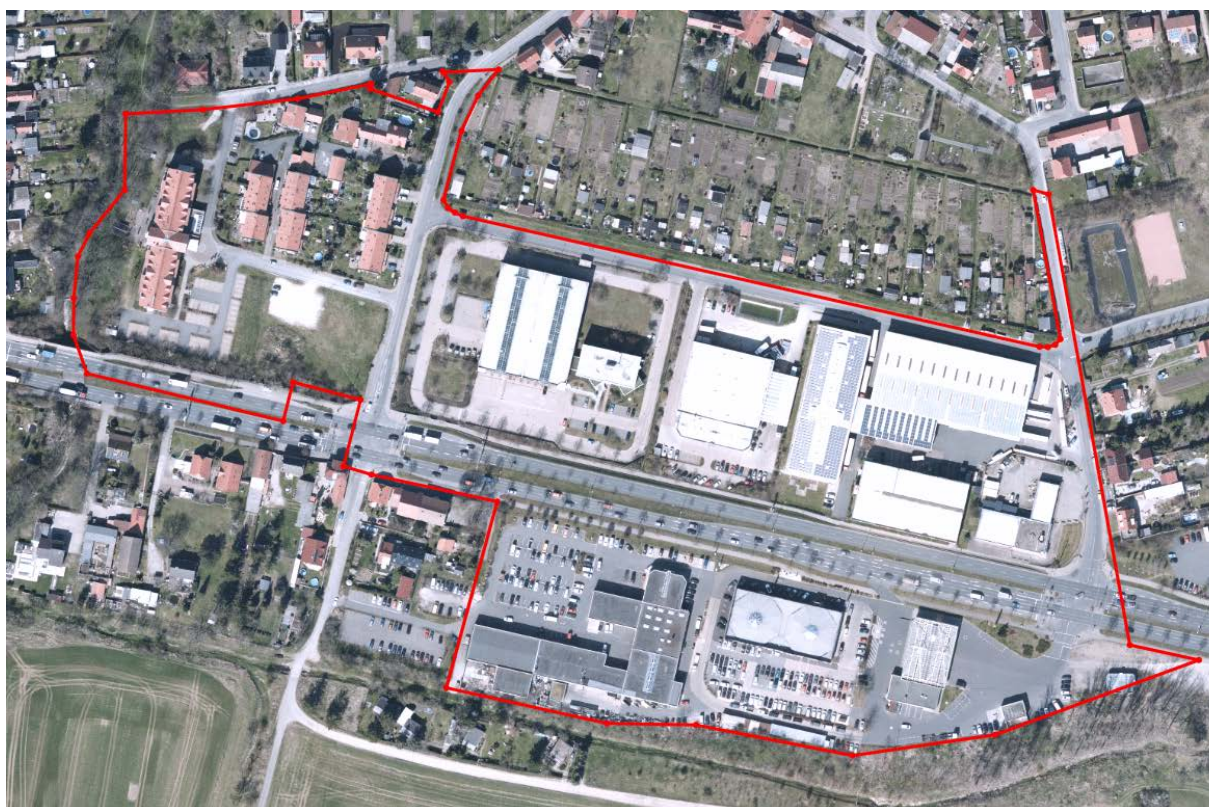
Luftbild Geltungsbereich Aufhebungssatzung LIA278

Im Bereich der Kleingartenanlage "Einheit Linderbach", nördlich des Geltungsbereiches der Aufhebungssatzung bleibt der Bebauungsplan LIA278 bestehen. Die Selbstständigkeit des bestehenden Teilbereichs ist weiter gewährleistet. Die Kleingartenanlage ist über die Straßen "Hinter den Wänden", "Am Weiherweg" und die "Azmannsdorfer Straße" erschlossen, Art und Maß der baulichen Nutzung (Kleingartenanlage) bleiben bestehen. Im Bebauungsplan LIA278 wurden keine überbaubaren Grundstücksflächen für die Kleingartenanlage festgesetzt. Dieser Teilbereich wird durch den neuen in Aufstellung befindlichen Bebauungsplan LIN742 "Kleingartenanlage Einheit Linderbach" vollständig überlagert.