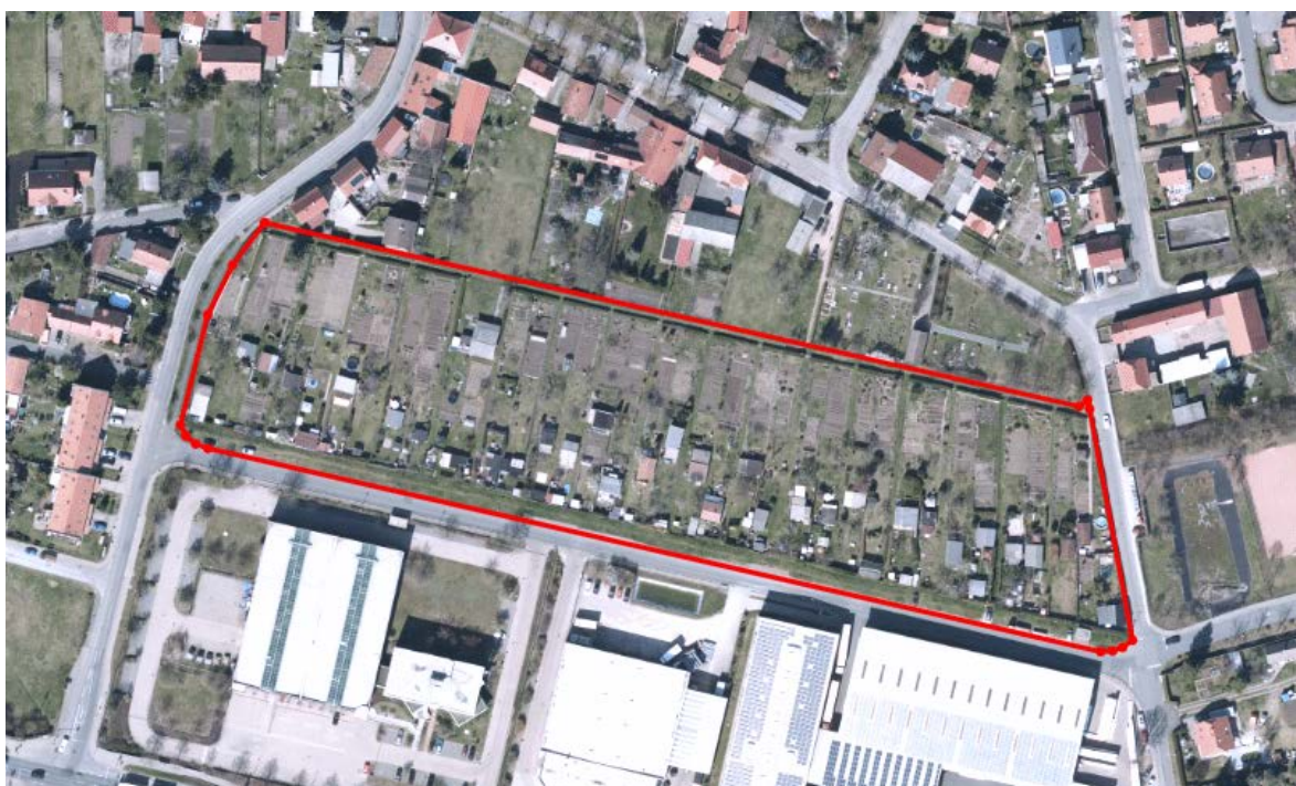
Luftbild Geltungsbereich LIN742 und bestehender Teilbereich LIA278

Im Bereich der Kleingartenanlage "Einheit Linderbach", nördlich des Geltungsbereiches der Aufhebungssatzung bleibt der Bebauungsplan LIA278 bestehen. Die Selbstständigkeit des bestehenden Teilbereichs ist weiter gewährleistet. Die Kleingartenanlage ist über die Straßen "Hinter den Wänden", "Am Weiherweg" und die "Azmannsdorfer Straße" erschlossen, Art und Maß der baulichen Nutzung (Kleingartenanlage) bleiben bestehen. Im Bebauungsplan LIA278 wurden keine überbaubaren Grundstücksflächen für die Kleingartenanlage festgesetzt. Dieser Teilbereich wird durch den neuen in Aufstellung befindlichen Bebauungsplan LIN742 "Kleingartenanlage Einheit Linderbach" vollständig überlagert.