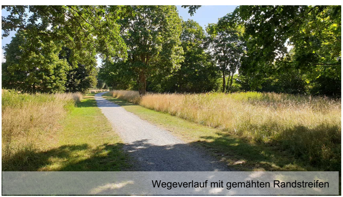
Wegeverlauf mit gemähten Randstreifen