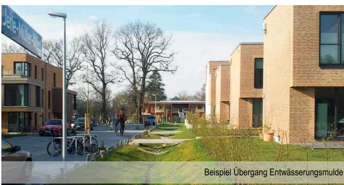
Beispiel Übergang Entwässerungsrunde