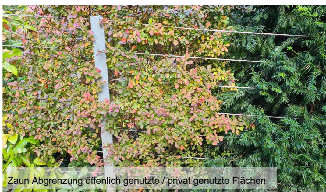
Zaun Abgrenzung öffentlich genutzte / privat genutzte Flächen