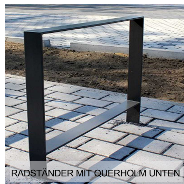
RADSTÄNDER MIT QUERHOLM UNTEN