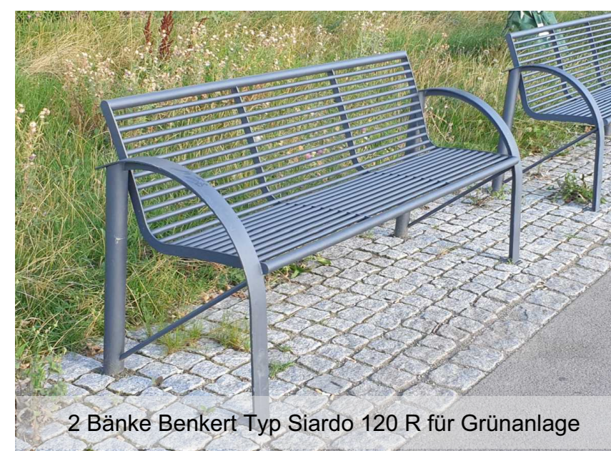
2 Bänke Benker Typ Slardo 120 R für Grünanlage