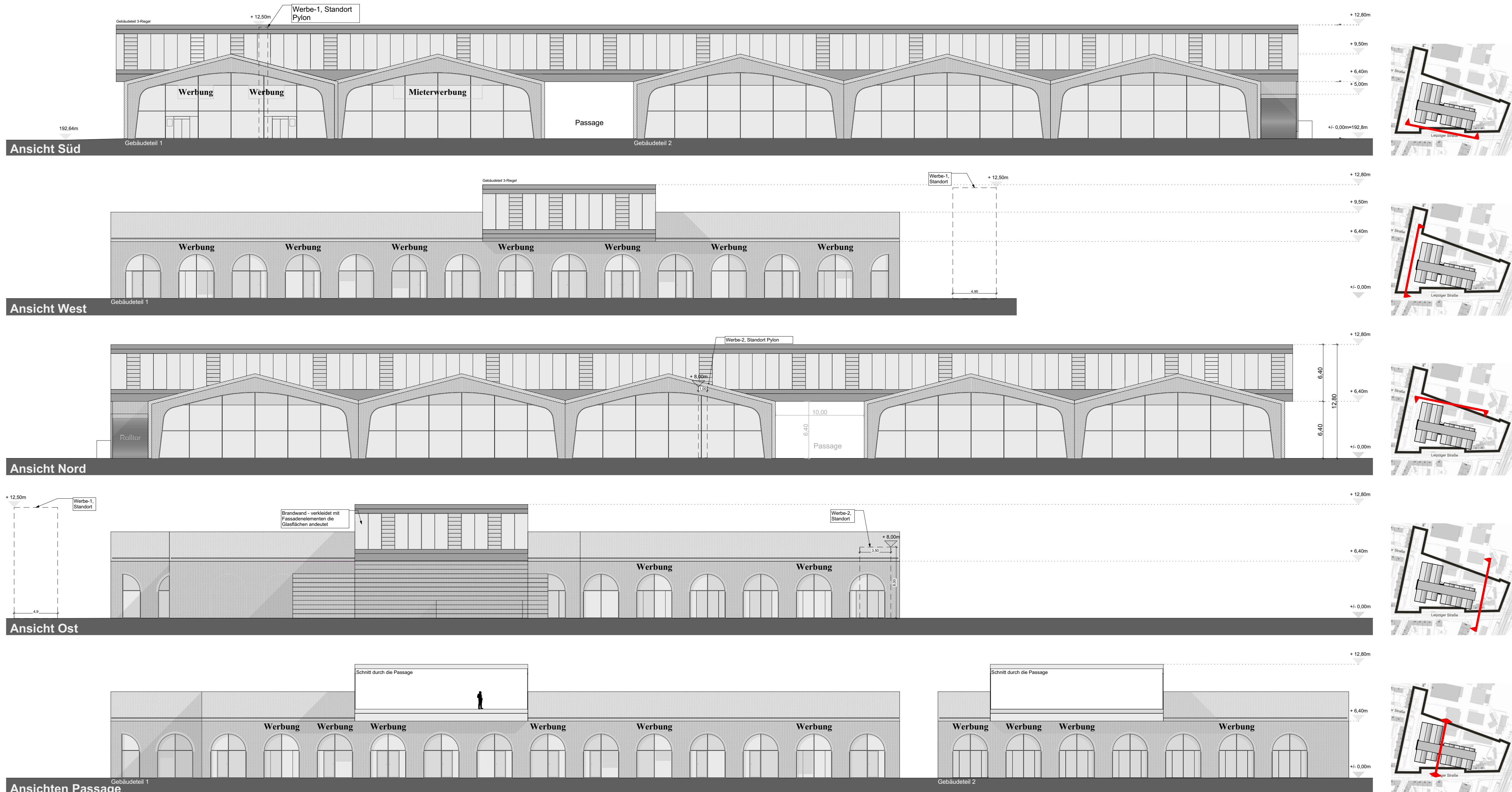
Ansichten M 1:250

Planverfasser: City- und Centermanagement Weimar GmbH In der Buttergrube 9 99428 Weimar-Legefeld