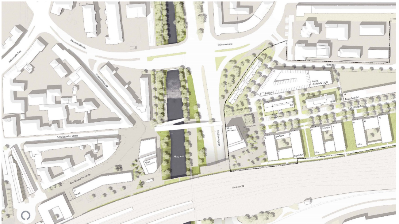
Abbildung 2 – Ausschnitt Rahmenplan "ICE-City, Teilbereich Ost / Neues Schmidtstedter Tor" (Machleidt GmbH) (Stand 11.02.2019, Stadtratsbeschluss Nr.0117/19 (Aufstellung und Vorentwurf des Bebauungsplans KRV706 „ICE-City Ost, Teil A“)

Im Wettbewerbsbeitrag betrug die geplante Höhe des Gebäudes 49,25\text{m} = 246,25\text{m NHN} , d.h. 75cm unter der Vorgabe von 50\text{m} = 247\text{m NHN} . Um eine tatsächliche Attika auszubilden, wäre die eigentliche Höhe bei der als maximal vorgegebenen Höhe von 50\text{m} = 247,00\text{m NHN} ausgenutzt gewesen.