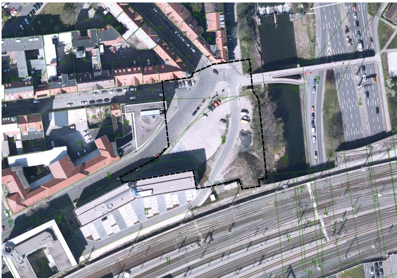
Abbildung 3 - Luftbild ohne Maßstab, mit schematischer Darstellung des Geltungsbereichs BPL ALT683