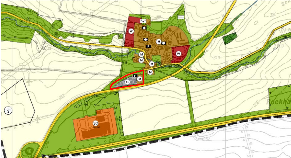
Abbildung 2: Markierung des Vorhabens (rot) im Flächennutzungsplan