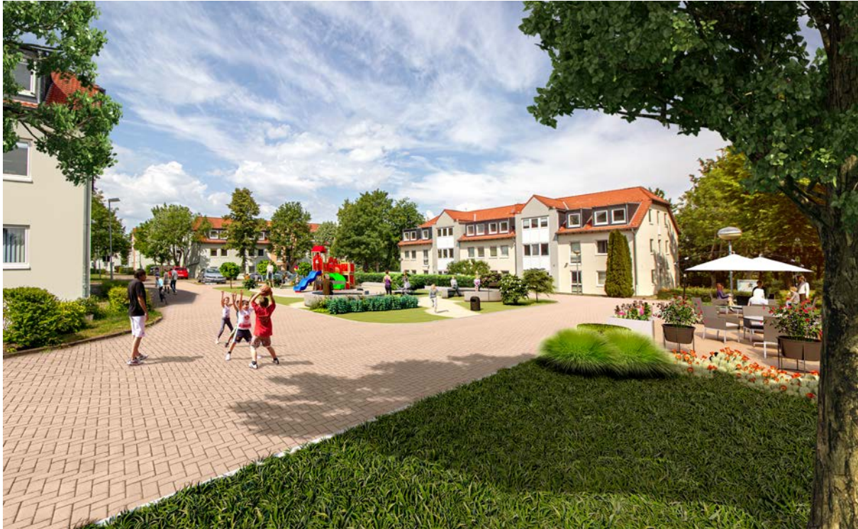
Abbildung 6: Vitalisierung bestehender zentraler Platz