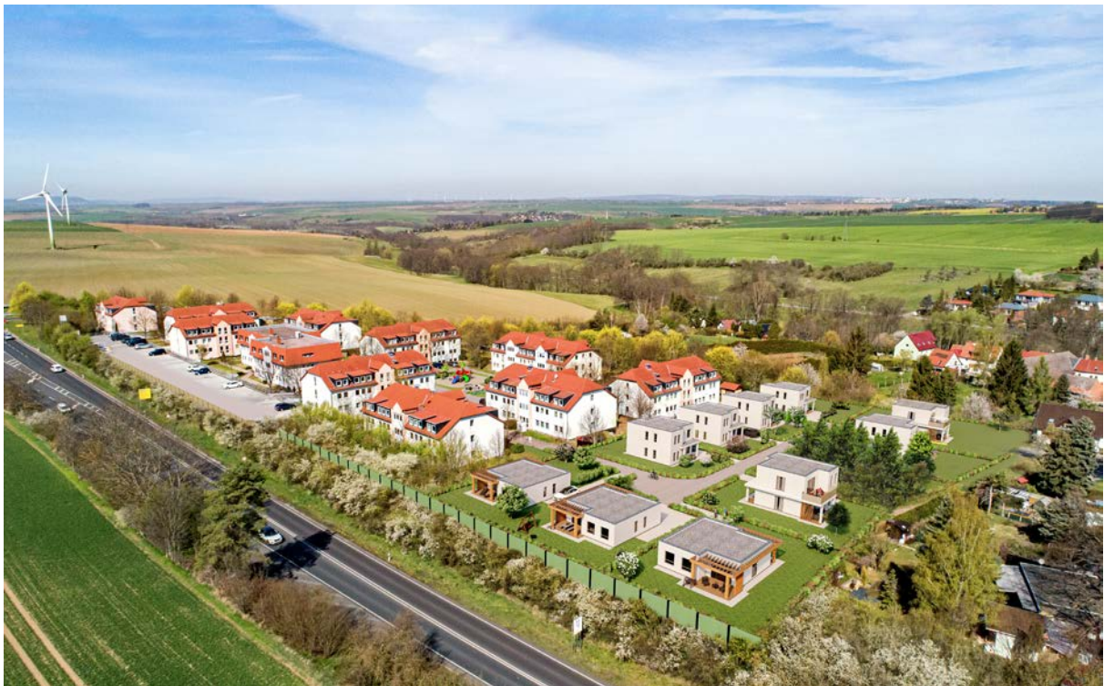
Abbildung 5: Übersicht des geplanten Vorhabens