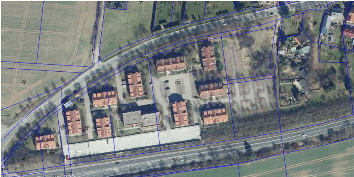
Abbildung 3: Luftbild Bestand

Auf Teilen des Betriebsgrundstückes ist Grünbestand vorhanden.