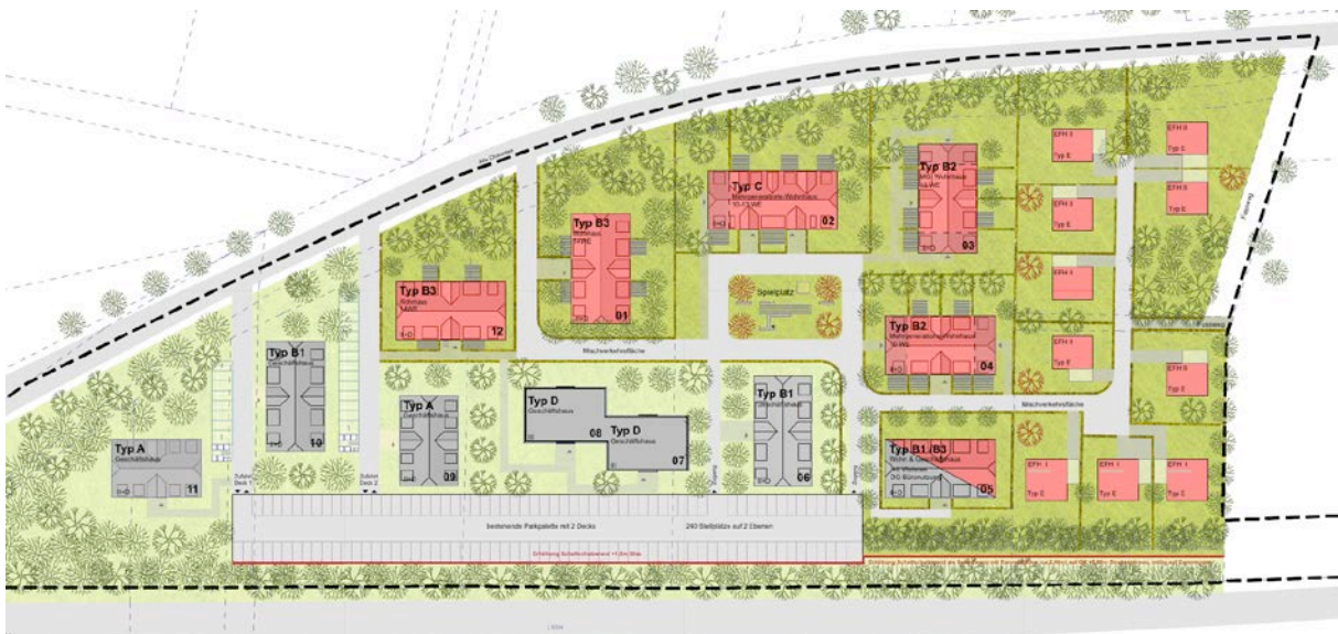
Abbildung 4: Verkleinerung des Vorhaben- und Erschließungsplanes, grau: Bürogebäude, rot: Wohngebäude