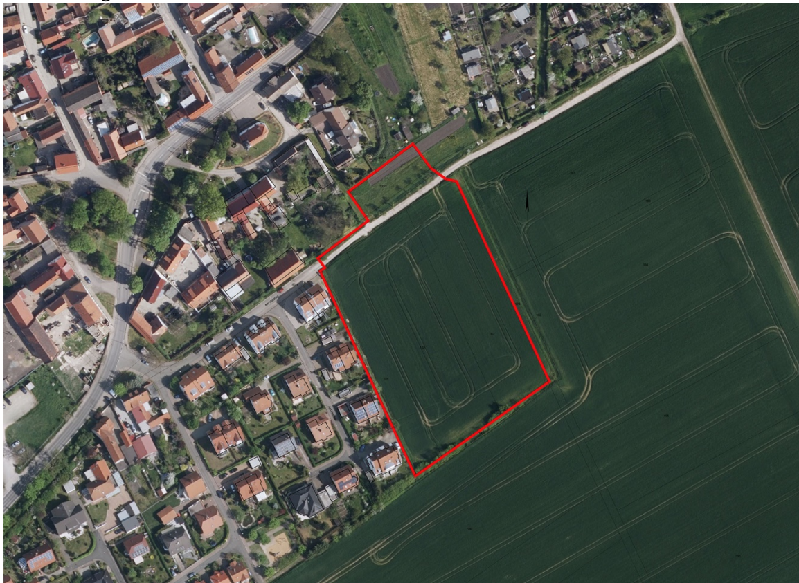
Lage des Plangebietes am südöstlichen Ortsrand von Töttleben (Digitales Orthophoto 2016)

Das Plangebiet befindet sich am südöstlichen Ortsrand von Töttleben unmittelbar im Anschluss an die bebaute Ortslage des Bebauungsplangebietes KER251 „Töttleben - Süd“. Die Flächen des Geltungsbereiches sind aktuell gänzlich unbebaut. Das Gelände weist eine geringe Neigung von ca. 3% in nördliche Richtung auf und kann damit als weitgehend ebenflächig bezeichnet werden.