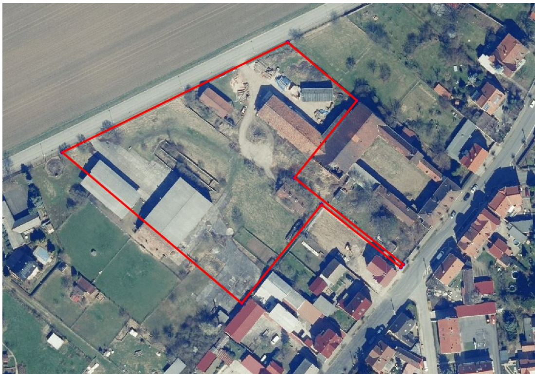
Luftbild Umgriff Planungsgebiet

Die Größe des Geltungsbereichs beträgt ca. 10.840 m 2 .