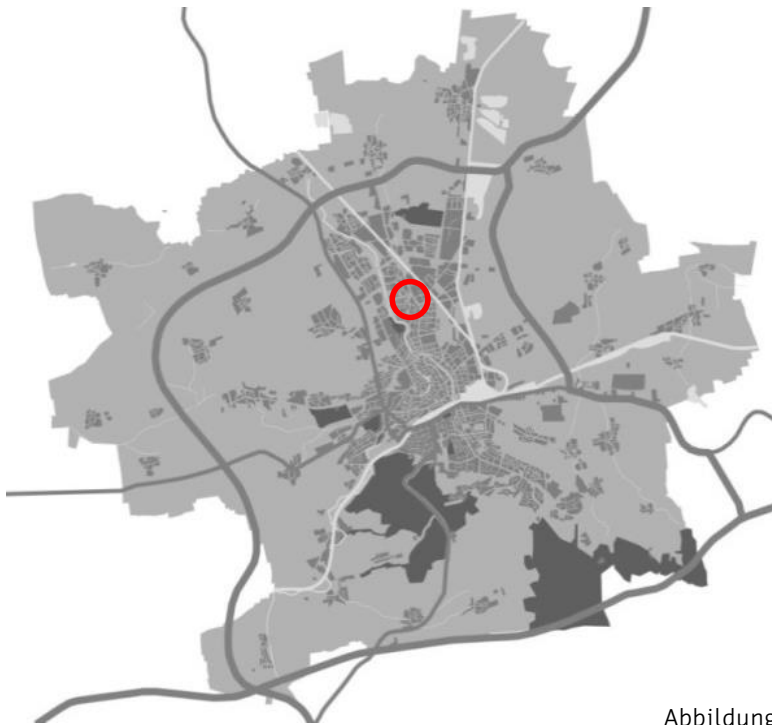
Abbildung 1 – Schemakarte zur Lage im Stadtgebiet