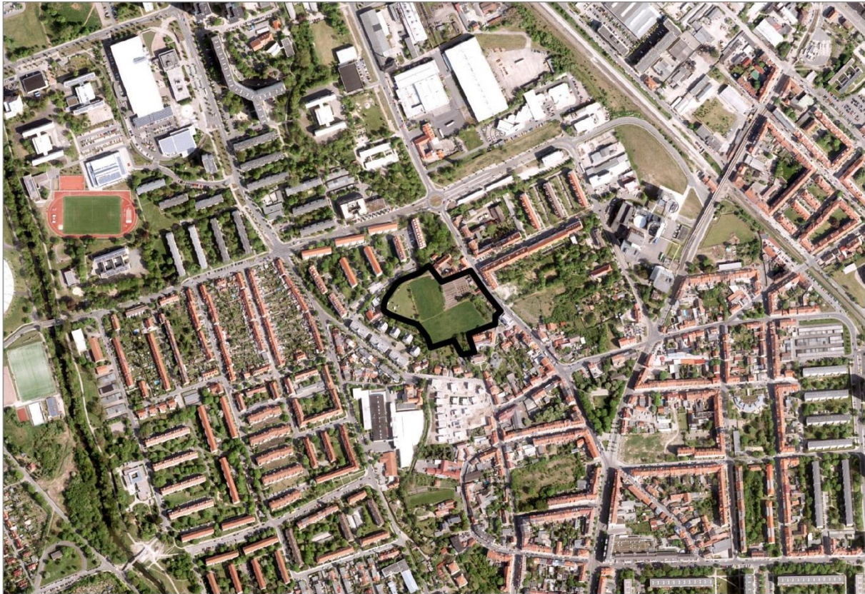
Abbildung 2 – Luftbild (unmaßstäblich)