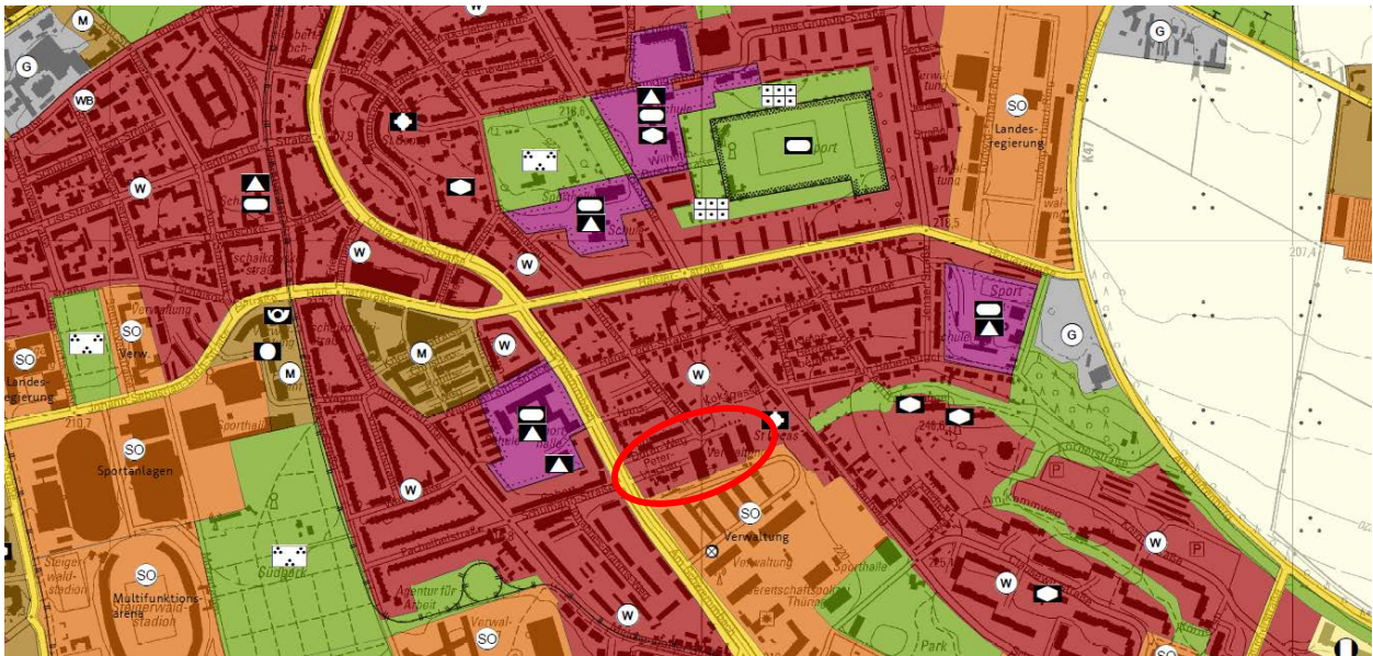
Abbildung 1: Auszug aus dem FNP der Stadt Erfurt mit abstrakter Kennzeichnung des Plangebietes (ohne Maßstab)