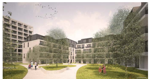
Abbildung 3: geplantes Vorhaben – Ansicht vom der Straße Am Schwemmbach und Ansicht Wohnhof, Visualisierung Junk & Reich Architekten