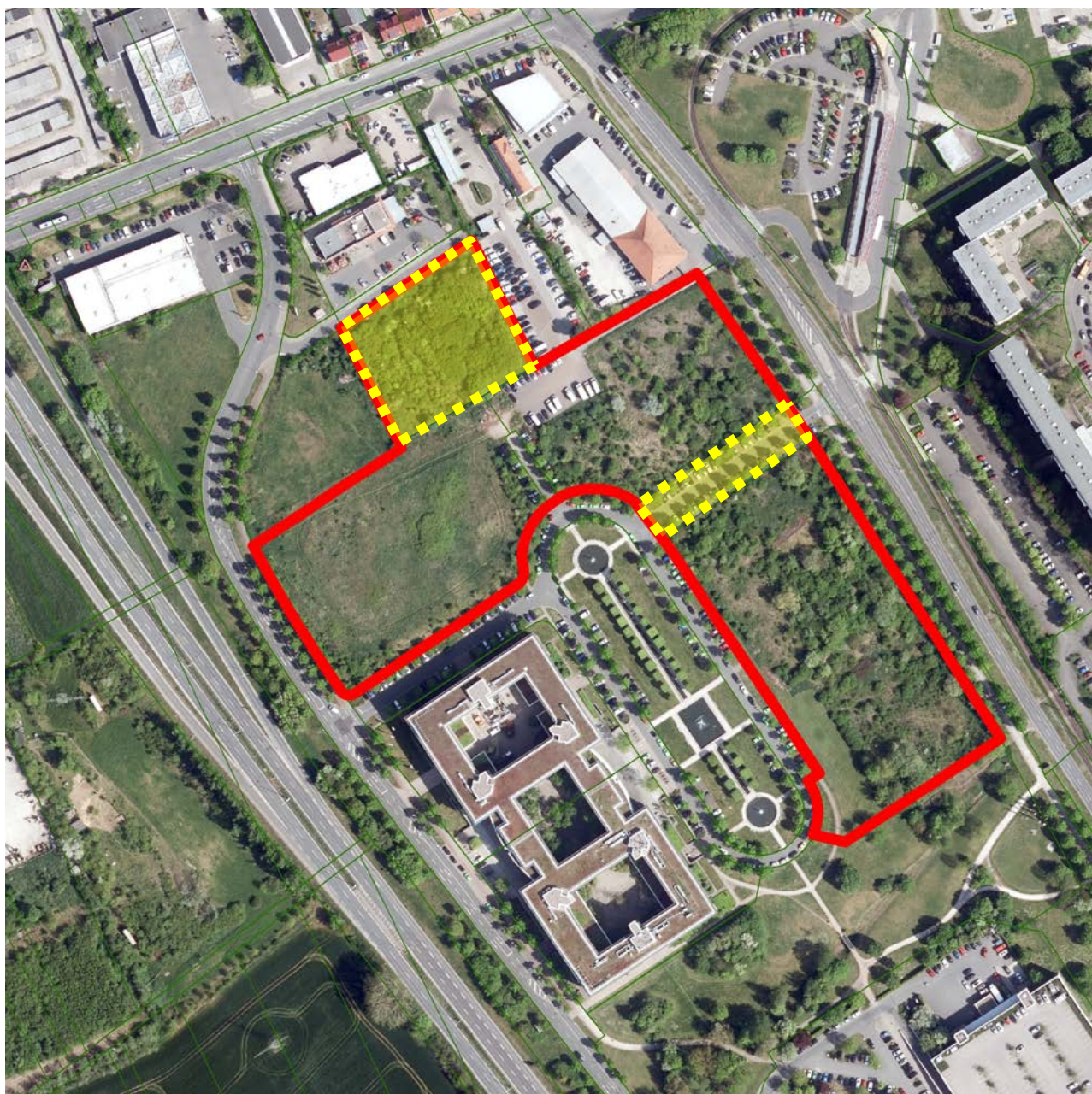
ungefähre Lage des Geltungsbereiches

Das Gelände auf dem Flurstück 228 der Flur 5, Gemarkung Gispersleben-Kiliani im Süden steigt von der Südostgrenze bis zur Nordwestgrenze um ca. 3 m, von der Nordostgrenze zur Südwestgrenze um ca. 2 m an. Die Flurstücke 224 und 225 im nördlichen Teil, für deren Bebauung der Architekturwettbewerb ausgelobt wurde, steigen im westlichen Teil um ca. 1 m von Süd nach Nord an. Das Niveau im östlichen Teil ist von Süd nach Nord annähernd auf gleicher Höhe. Das nördlich daran angrenzende Flurstück 643/10 der Flur 7, Gemarkung Gispersleben-Kiliani fällt von Süd nach Nord um ca. 3,0 m, sowie von West nach Ost um ca. 1,5 m.