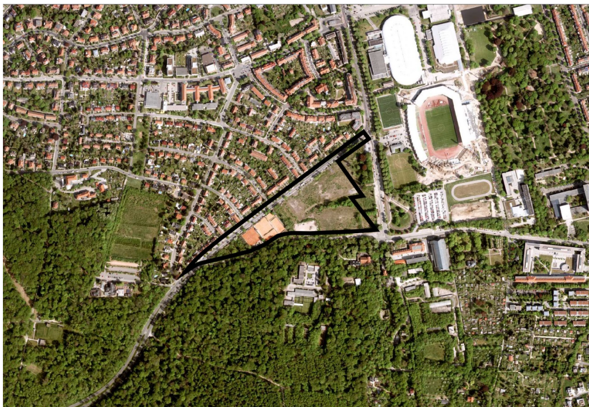
Abbildung 2 – Luftbild M 1:10.000