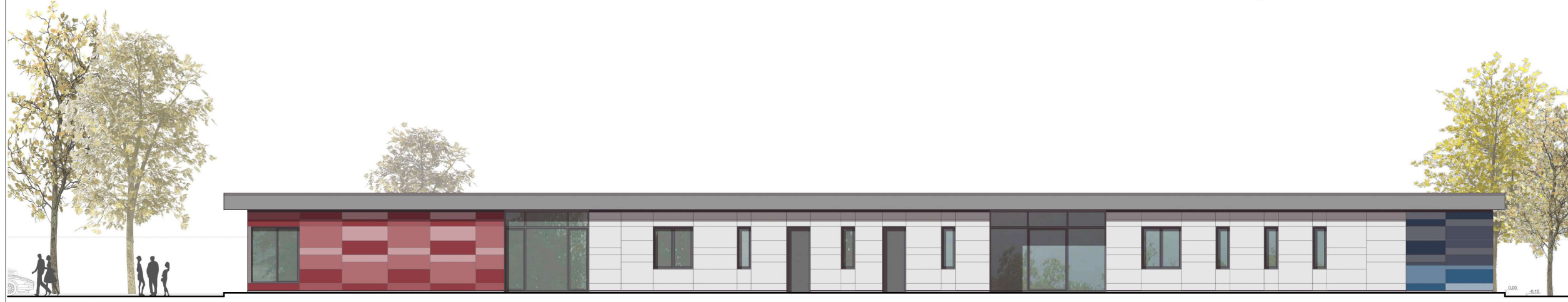
Ansicht Ost M 1:100