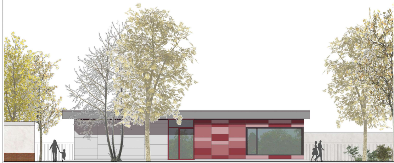
Ansicht Süd | Eingangsfassade M 1:100