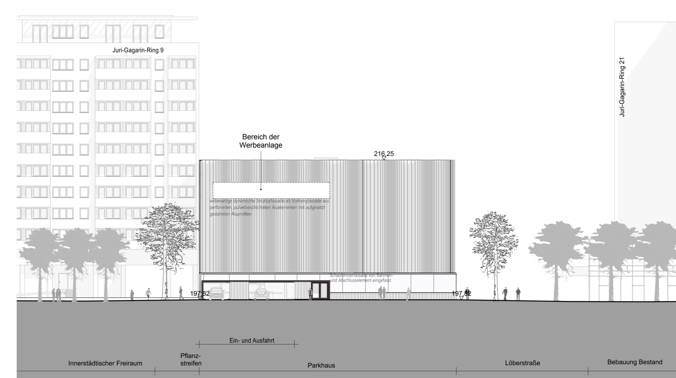
Südostansicht des Gebäudes im Baufeld 2 (am Juri-Gagarin-Ring), Ansicht vom Juri-Gagarin-Ring

Die Übereinstimmung des textlichen und zeichnerischen Inhalts dieses Vorhaben- und Erschließungsplans mit dem Willen der Landeshauptstadt Erfurt sowie die Einhaltung des gesetzlich vorgeschriebenen Verfahrens zur Aufstellung des vorhabenbezogenen Bebauungsplans werden bekundet.