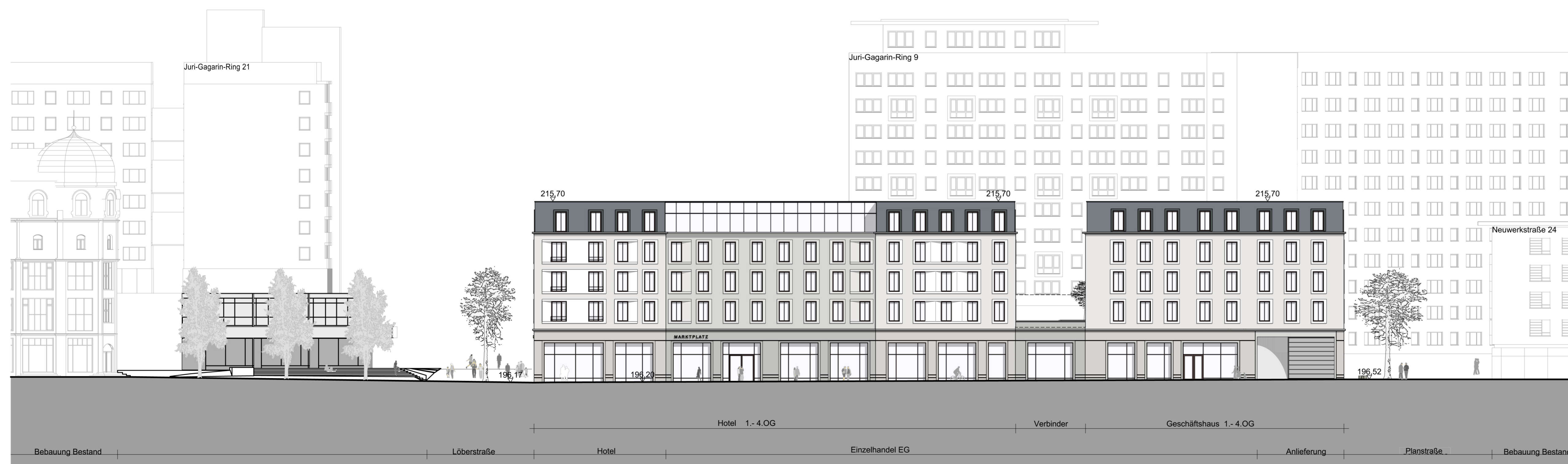
Nordwestansicht des Gebäudes im Baufeld 1 (an der Neuwerkstraße), Ansicht von der Neuwerkstraße