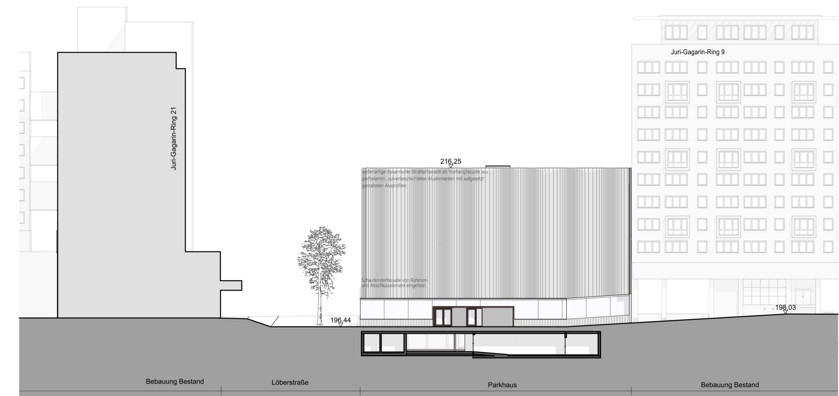
Nordwestansicht des Gebäudes im Baufeld 2 (am Juri-Gagari-Ring) und Schnitt des unterirdischen Gebäudes im Baufeld 3, Ansicht von der Fläche GF