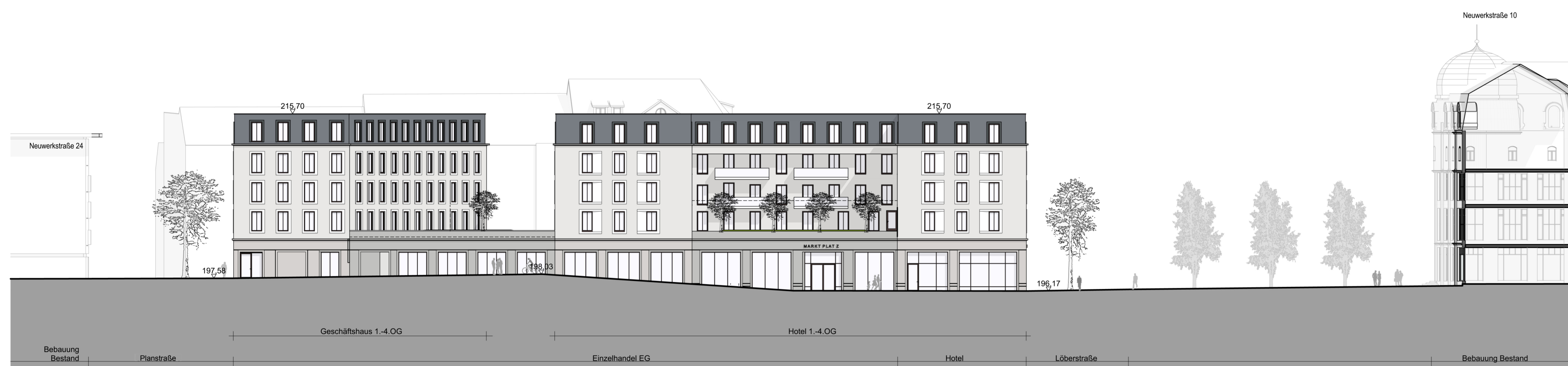
Südostansicht des Gebäudes im Baufeld 1 (an der Neuwerkstraße), Ansicht von den Flächen GF und GFL