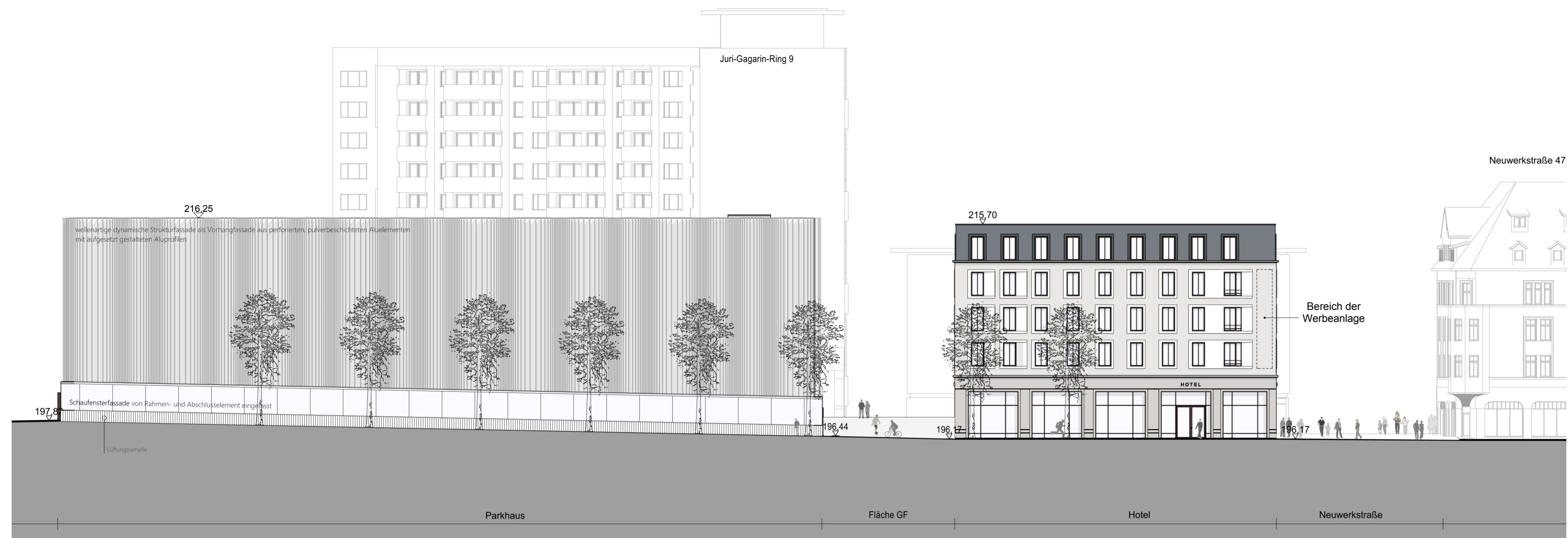
Nordostansicht des Gebäudes im Baufeld 2 (am Juri-Gagarin-Ring) und des Gebäudes im Baufeld 1 (an der Neuwerkstraße), Ansicht von der Löberstraße