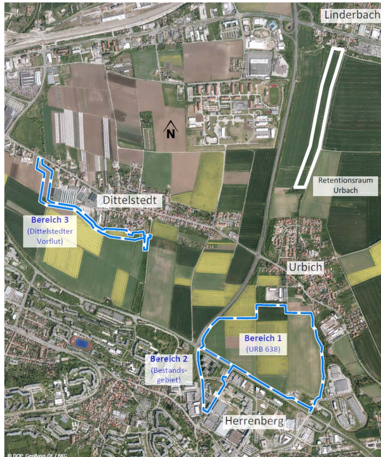
Abb. 1: Übersichtslageplan zu den Änderungsbereichen

Die Änderungsbereiche (siehe Abb. 1), mit dem Vorhabensgebiet URB 638 (Bereich 1), dem Bestandsgebiet (Bereich 2) und der externen Kompensationsmaßnahme Dittelstedter Vorflut (Bereich 3), befinden sich 4-5 km südöstlich der Erfurter Innenstadt in den Ortsteilen Urbich, Herrenberg und Dittelstedt. Die weitere externe Kompensationsmaßnahme Retentionsraum Urbich (keine Änderung erforderlich) verläuft nördlich von Urbich bis in die Gemarkung von Linderbach hinein.