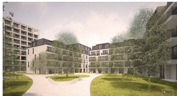
Abbildung 3: geplantes Vorhaben – Ansicht vom der Straße Am Schwemmbach und Ansicht Wohnhof, Visualisierung Junk & Reich Architekten