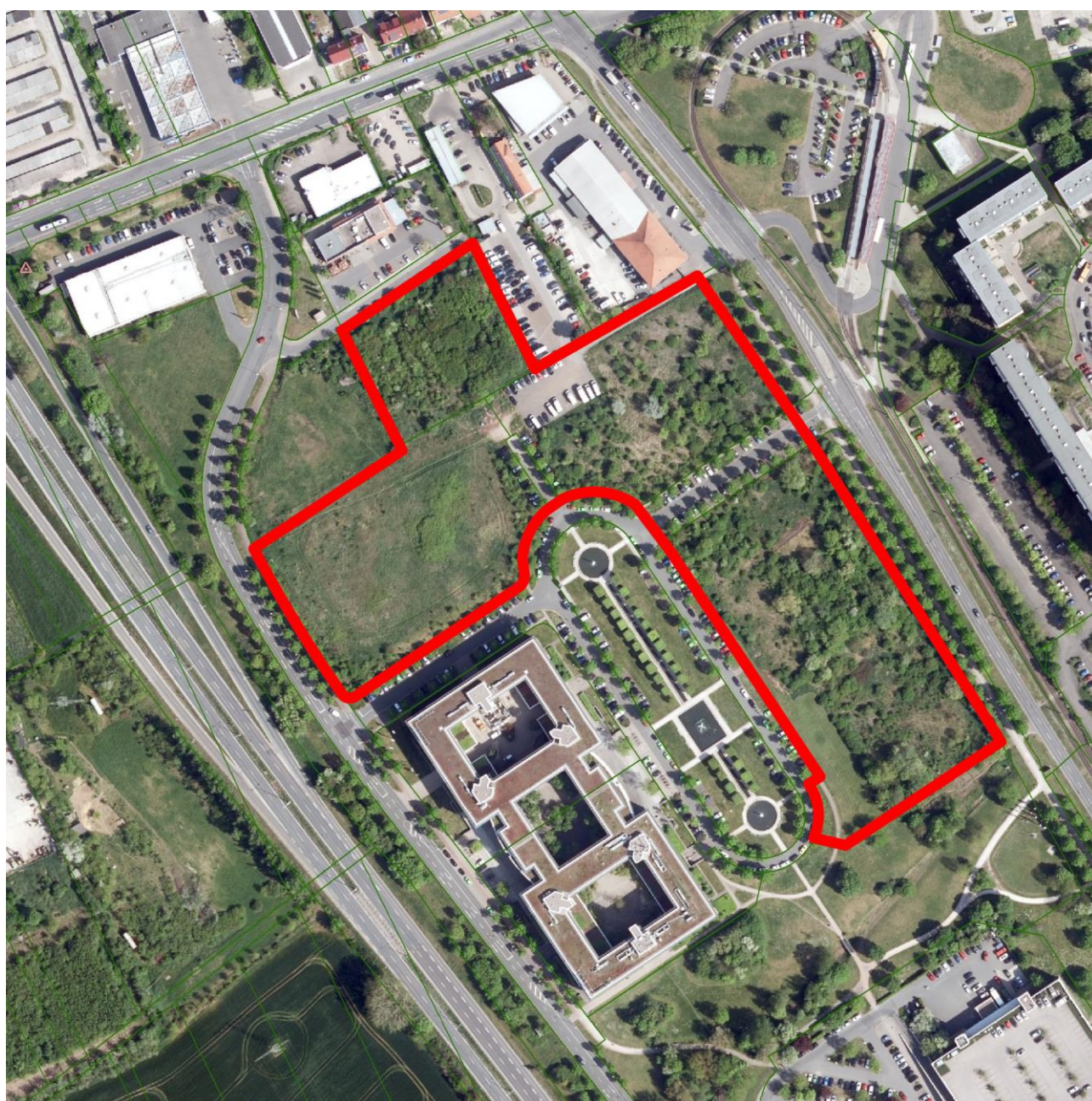
ungefähre Lage des Geltungsbereiches

Das nördlich daran angrenzende Flurstück 643/10 der Flur 7, Gemarkung Gispersleben-Kiliani fällt von Süd nach Nord um ca. 3,0 m, sowie von West nach Ost um ca. 1,5 m.