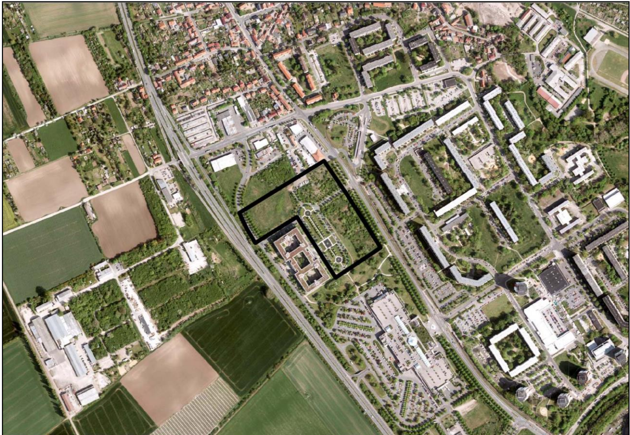
Abbildung 2 – Luftbild (unmaßstäblich), Stand: 10.05.2016

zuständigen Grundschule oder der Regelschule oder der Kindertageseinrichtungen im Bereich Gispersleben bzw. im Planungsraum ländliche Ortsteile möglich. Eine Konkretisierung hinsichtlich des aus der FNP-Änderung entstehenden Bedarfes und der notwendigen Maßnahmen zur Bereitstellung von Kindertages- und Schulplätzen kann jedoch im Rahmen der entsprechenden Fachplanungen (u.a. Kindertagesstättenbedarfsplanung, Schulnetzplan). 1 erfolgen"