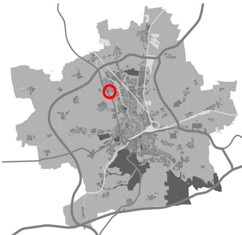
Abbildung 1 - Schemakarte zur Lage im Stadtgebiet

Der Änderungsbereich umfasst eine Fläche von 4,4 ha. Die mittlere Entfernung des Gebietes zum Stadtzentrum/ Anger beträgt ca. 5 km, zum Domplatz ca. 4,5 km.