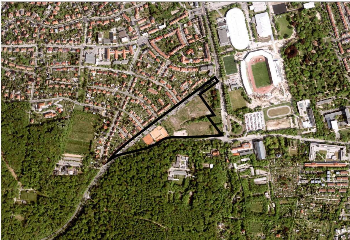
Abbildung 2 – Luftbild M 1:10.000