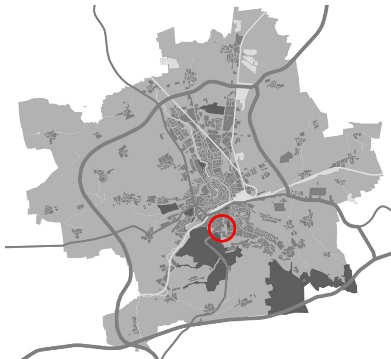
Abbildung 1 - Schemakarte zur Lage im Stadtgebiet

Der Änderungsbereich für den wirksamen Flächennutzungsplan der Stadt Erfurt befindet sich im Stadtteil Löbervorstadt, unmittelbar am nördlichen Hangfuß des Steigernordrandes. Umgrenzt wird der Änderungsbereich im Wesentlichen durch: