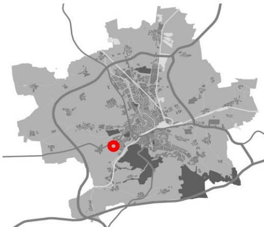
Abbildung 1 - Schemakarte zur Lage im Stadtgebiet

Der Änderungsbereich umfasst eine Fläche von 10,6 ha. Die mittlere Entfernung des Gebietes zum Stadtzentrum/ Anger beträgt ca. 3,5 km, zum Domplatz ca. 4,0 km.