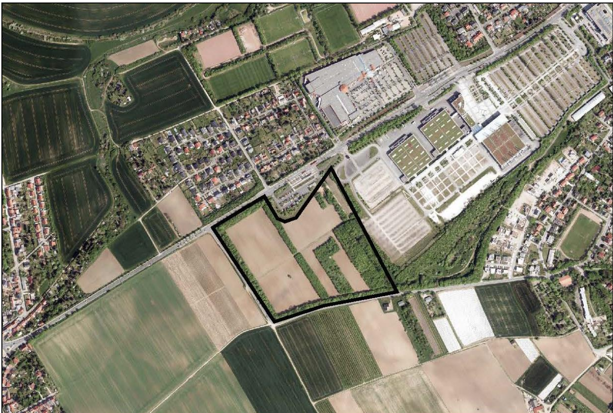
Abbildung 2 – Luftbild (unmaßstäblich)

Das Plangebiet kann über die Gothaer Straße (von der Wartburgstraße) an das regionale und überregionale Straßennetz (A 71 - Anschlussstelle "Bindersleben") angebunden werden. Die Eisenacher/Gothaer Straße ist eine der wichtigen Stadteinfahrten von Erfurt für den KFZ -Verkehr sowie den ÖPNV. Hinsichtlich des ÖPNV grenzt das Plangebiet direkt an die Endhaltestelle der Stadtbahnlinie 2 "P+R Platz Messe" sowie die Haltestelle der Buslinie 80. Entlang der Gothaer Straße verläuft ein kombinierter Geh- und Radweg, entlang der Wartburgstraße ein Gehweg. Medien des öffentlichen Ver- und Entsorgungssystems befinden sich im angrenzenden öffentlichen Straßennetz. Für die im Plangebiet der FNP-Änderung Nr. 35 vorgesehenen baulichen Nutzungen ist voraussichtlich im Bereich des Eselsgrabens nördlich der Gothaer Straße ein u.a. die Belange des Hochwasserschutzes berücksichtigendes Regenrückhaltebecken erforderlich. Der Anschluss des Plangebietes ist (insbesondere bzgl. der abwassertechnischen Erschließung) im Rahmen nachfolgender Planungen zu konkretisieren.