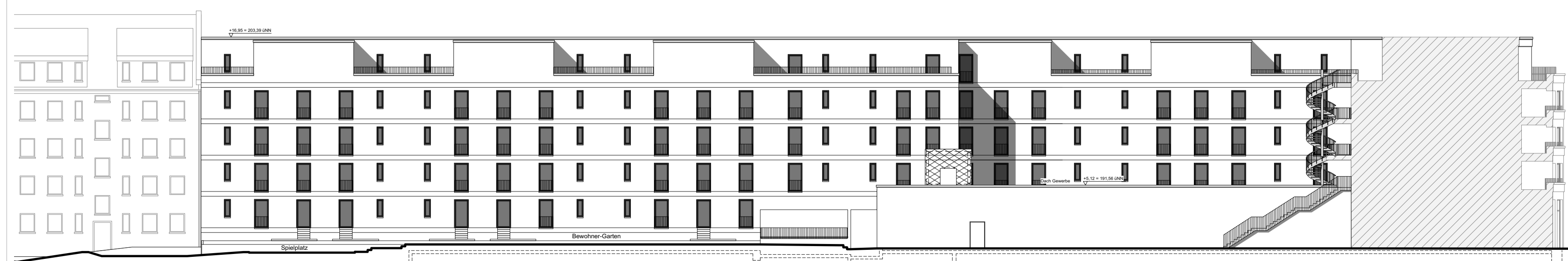
Ansicht Stollbergstraße (Hofseite)