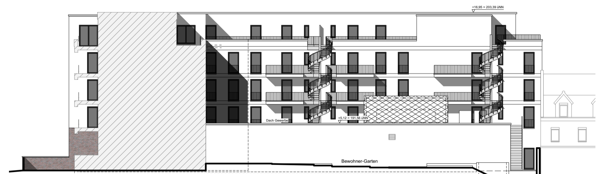
Ansicht Magdeburger Allee (Hofseite)