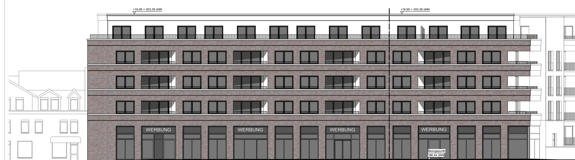
Ansicht Magdeburger Allee