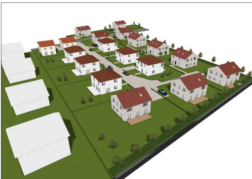
Virtuelles 3-D-Modell einer zukünftigen Bebauung Perspektive aus Süd-Ost; © ASK Bauplanung GmbH, Berlin

Entsprechend der aktuellen Nachfrage nach Baugrundstücken in Töttleben enthält das Planungskonzept 18 Grundstücke mit einer durchschnittlichen Größe von ca. 621 m 2 . Die Grundstücksgrößen variieren dabei zwischen 364 m 2 und 1.007 m 2 . Je nach Lage des Baufeldes können dementsprechend die im Bebauungsplan festzusetzenden Grundflächen- und Geschossflächenzahlen (GRZ und GFZ) für die unterschiedlichen Baufelder variabel definiert werden.