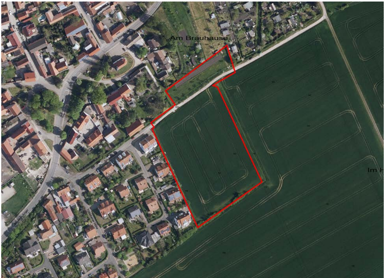
Lage des Plangebietes am südöstlichen Ortsrand von Töttleben (Digitales Orthophoto 2016)

Das Plangebiet befindet sich am südöstlichen Ortsrand von Töttleben unmittelbar im Anschluss an die bebaute Ortslage des Bebauungsplangebietes KER251 „Töttleben - Süd“. Die Flächen des Geltungsbereiches sind aktuell gänzlich unbebaut. Das Gelände weist eine geringe Neigung von ca. 3% in nördliche Richtung auf und kann damit als weitgehend ebenflächig bezeichnet werden.