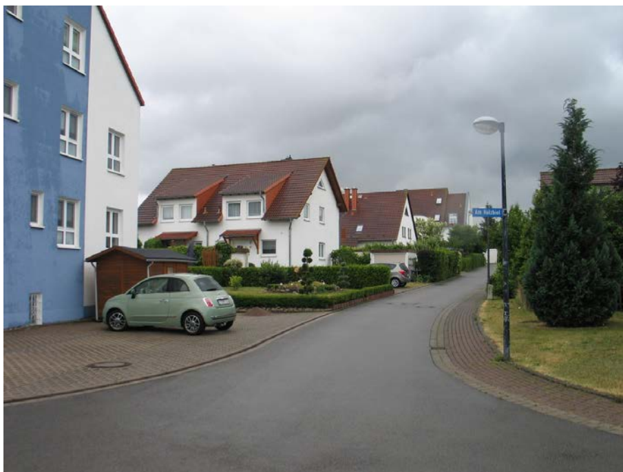
ein- und zweigeschossige Bebauung an der in südöstliche Richtung verlaufenden Straße „Am Holzbiel“ (Juni 2018);

in nordöstliche Richtung verlaufenden Abschnitt der Straße „Am Holzbiel“. Die vorhandene Bebauung nordwestlich der Straße " Am Holzbiel " ist durch die von landwirtschaftlichen Nebengebäuden und Wirtschaftsgärten geprägten Rückseiten der über die Straße "Am Alten Anger" erschlossenen Hofstellen der traditionell dörflichen Bebauung charakterisiert.