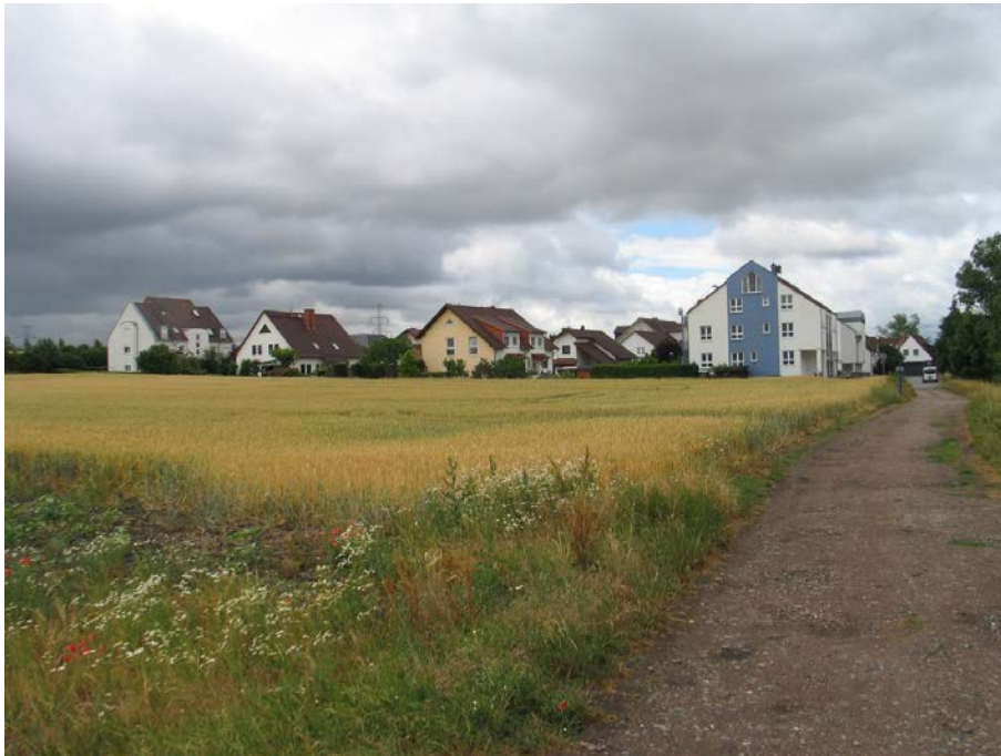
Heutiger Ortsrand; Blick von der nordöstlichen Grenze des Plangebietes in südwestliche Richtung (Juni 2018);