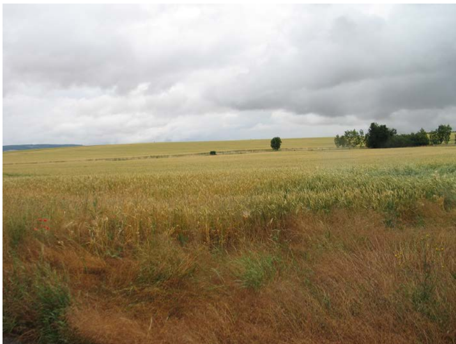
Ackerflächen (Juni 2018); Blick von der Straße „Am Holzbiel“ in östliche Richtung

säumt. Die Gewässerparzelle einschließlich der Ufergehölze befinden sich außerhalb des Geltungsbereiches.