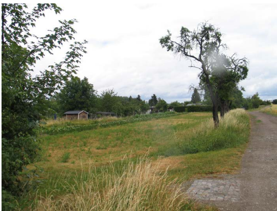
kleinteilige Acker- und Grünlandflächen nördlich des Wirtschaftsweges (Juni 2018); Blick vom Wirtschaftsweg in nördliche Richtung