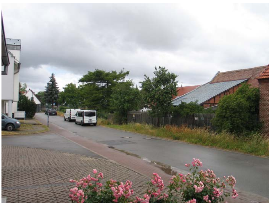
Straße „Am Holzbiel“ (Juni 2018); Blick vom Ortsrand in südwestliche Richtung