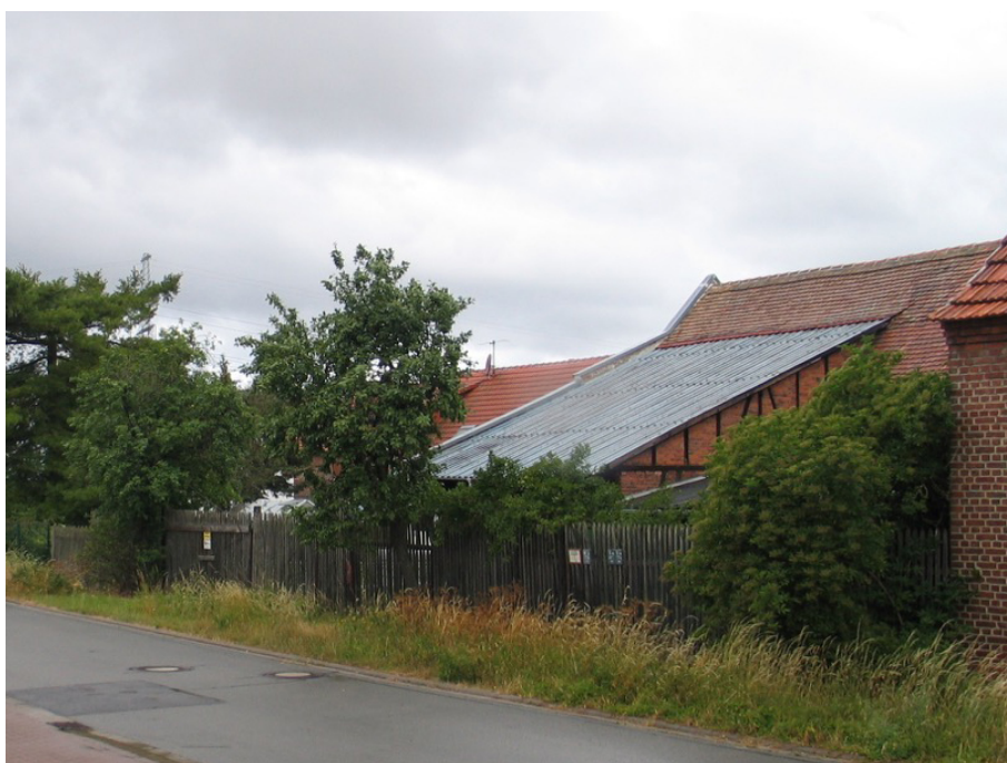
Rückseiten der traditionell dörflichen Bebauung an der Straße „Am Holzbiel“ (Juni 2018);