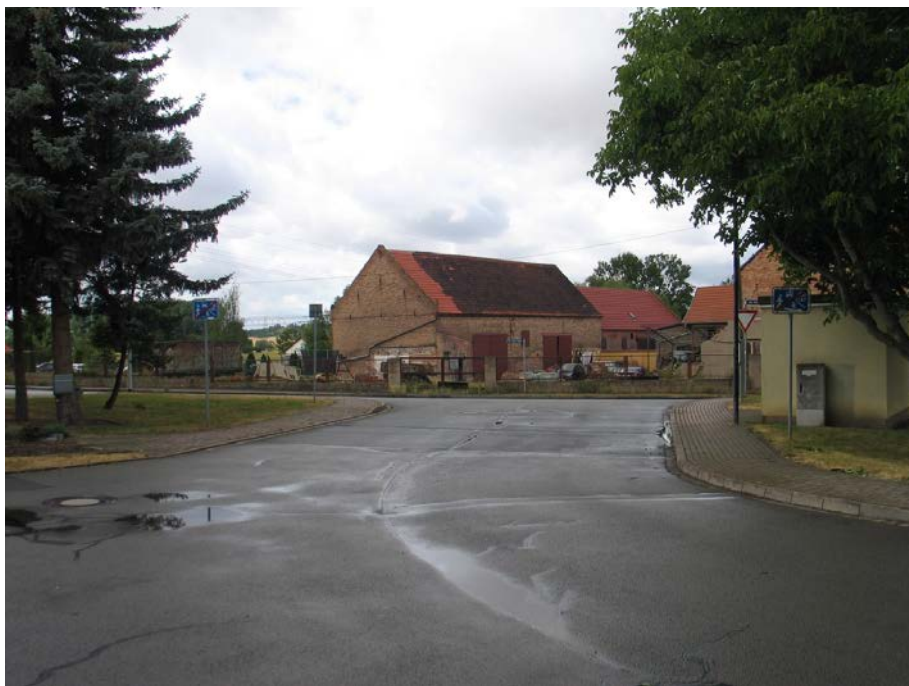
Einmündungsbereich der Straße „Töttlebener Höhe“ in die L 1055 „Am Alten Anger“ (Juni 2018); Blick aus der Straße „Töttlebener Höhe“ in westliche Richtung