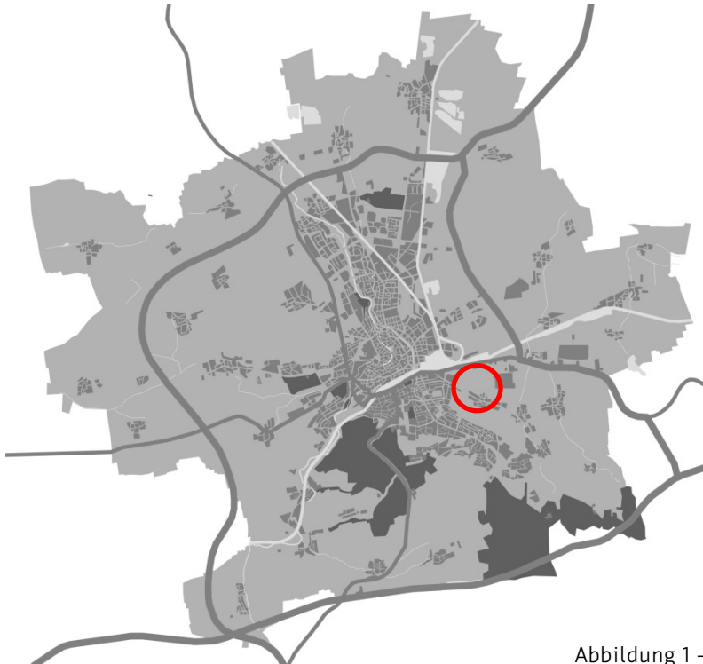
Abbildung 1 – Schemakarte zur Lage im Stadtgebiet

Maßgeblich für den Änderungsbereich ist die Planzeichnung zur Änderung.