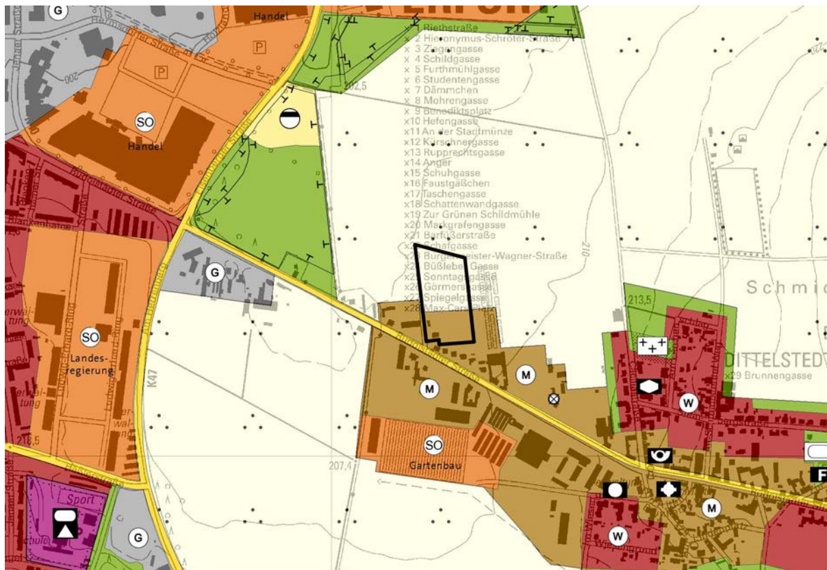
Abbildung 3 - Auszug Neubekanntmachung des Flächennutzungsplan der Stadt Erfurt vom 14.07.2017, Maßstab 1 : 25.000, Stand 24.03.2017

bau dargestellt. (...) Wichtige, zusammenhängend zu erhaltende agrarisch genutzte Bereiche sind: - Dittelstedt-Urbich-Büßleben, (...)“