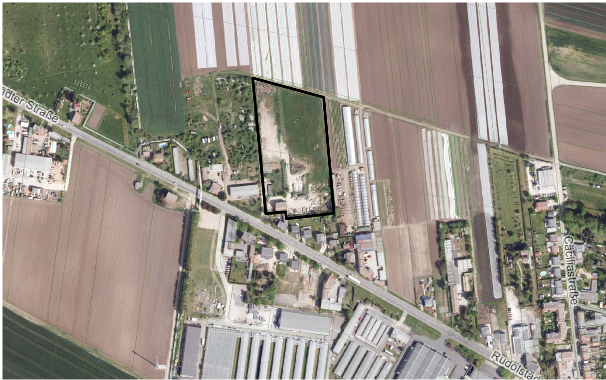
Abbildung 2 – Luftbild M 1:5.000, Stand: 10.05.2016

ger- und Abstellflächen sowie weitere landwirtschaftliche Flächen sowie westlich der Eisenberger Straße mit dem Einkaufszentrum TEC eine großflächige Einzelhandelseinrichtung.