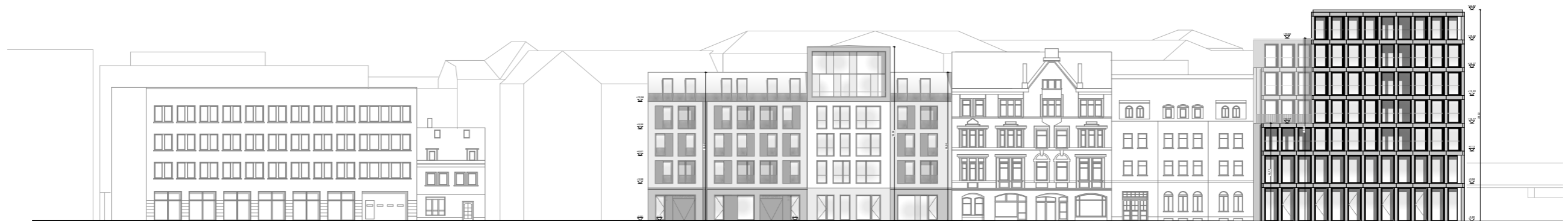
Ansicht Schmidstedter Straße

Entwicklung des Areals Schmidstedter Str. 38/39 & 43/44, Willy-Brandt-Platz 5 und Kurt-Schumacher-Str. 1