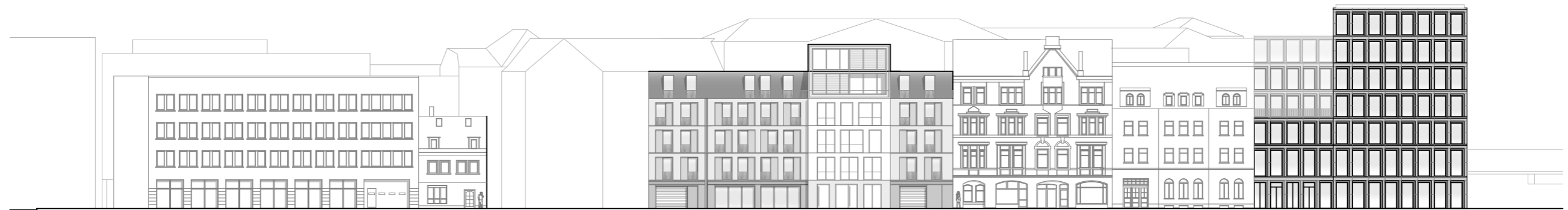
Ansicht Schmidtstedter Straße

Entwicklung des Areals Schmidtstedter Str. 38/39 & 43/44, Willy-Brandt-Platz 5 und Kurt-Schumacher-Str. 1