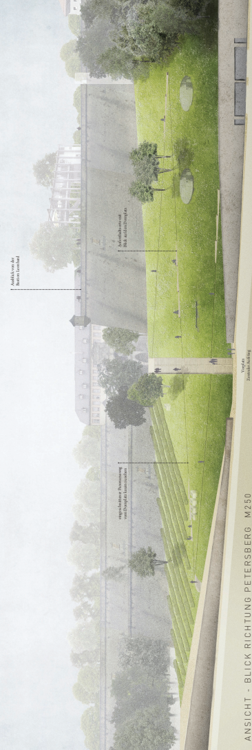
ANSICHT - BLICK RICHTUNG PETERSBERG M250