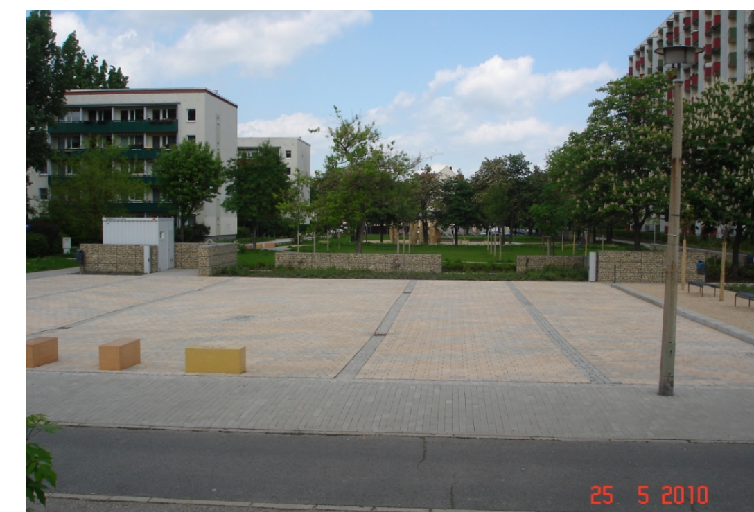
Marktfäche mit Natursteinbänderungen als Aufstellmarkierung