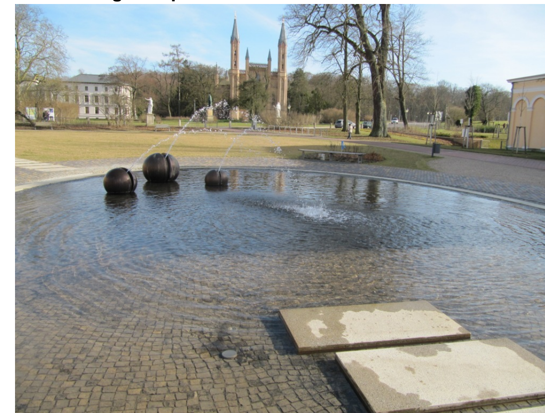
Platz mit Fontänenfeld kreisrundes Wasserspiel als Erdkugel mit Fontänen