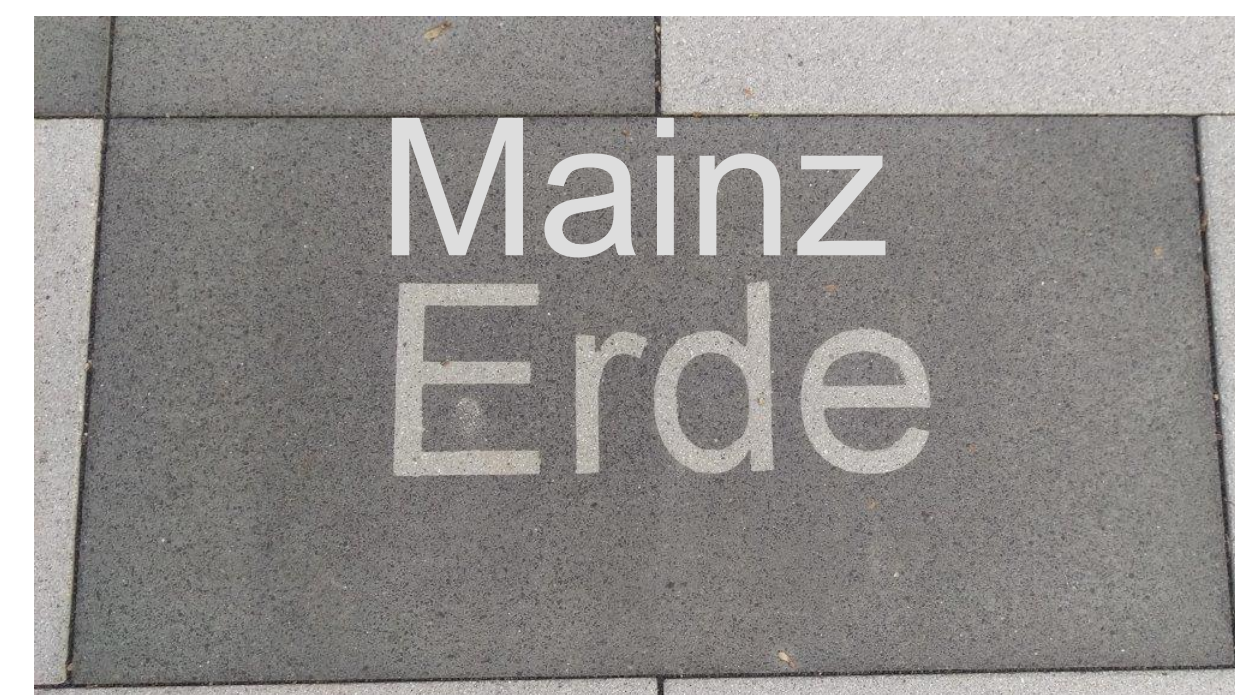
Schriftzug Partnerstädte im Bodenbelag als Brunneneinfassung