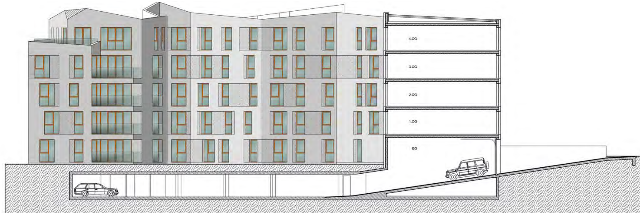
Ansicht West - Schnitt Haupthaus