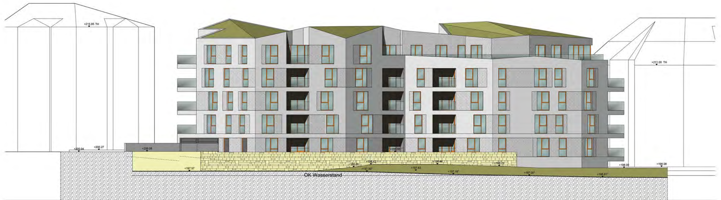
Ansicht Süd - Strasse des Friedens