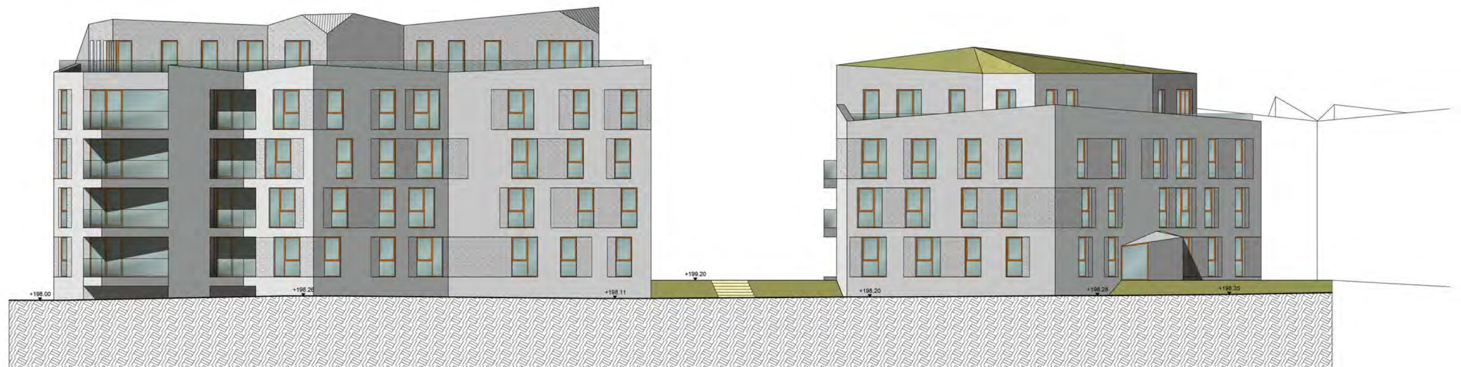
Ansicht Ost - Haupt-/ Hofhaus