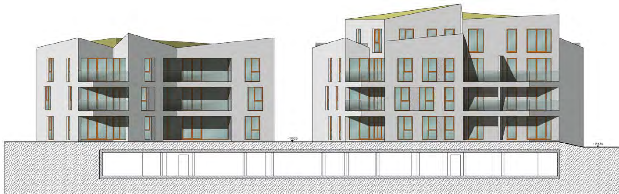
Ansicht Süd - Hofhäuser