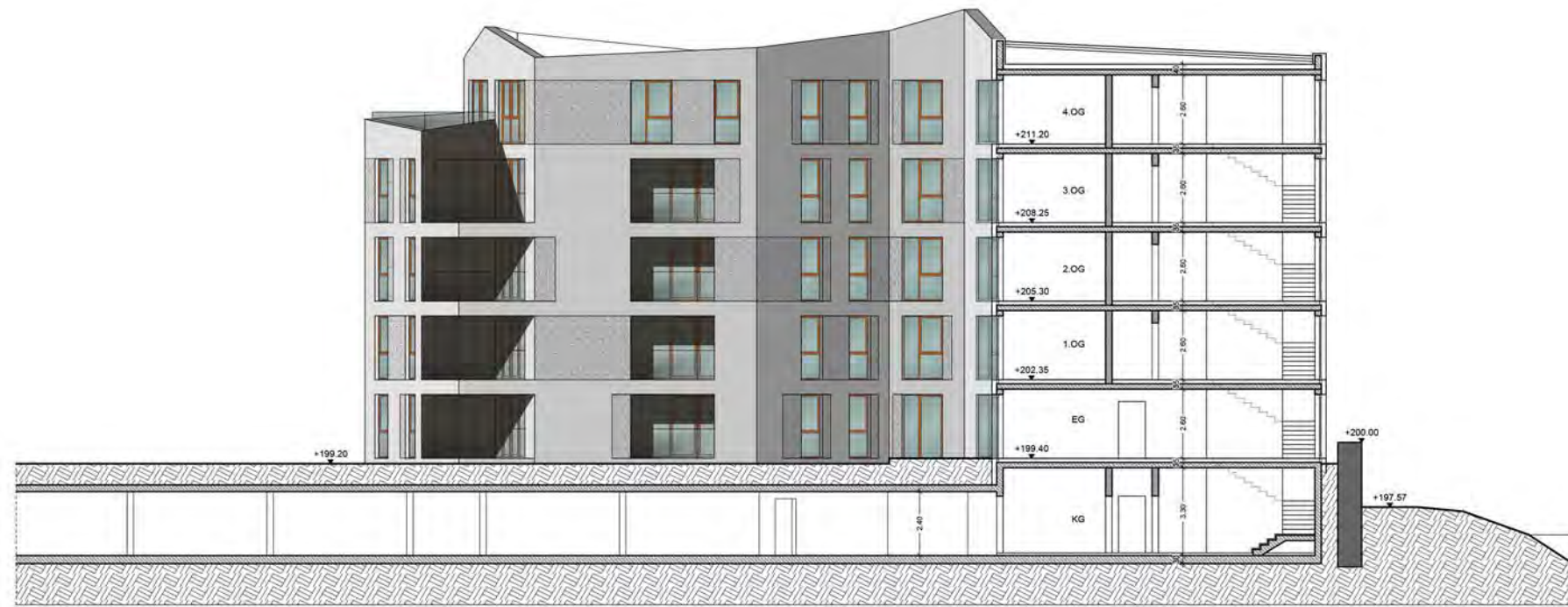
Ansicht West - Schnitt Haupthaus