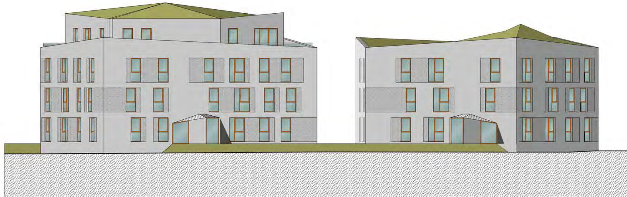
Ansicht Nord - Hofhäuser