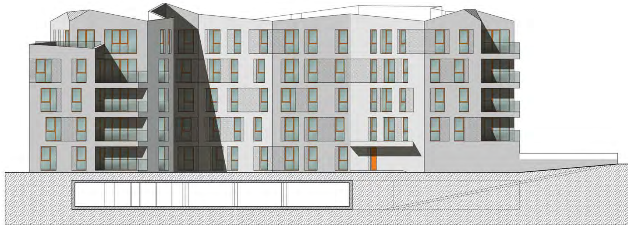
Ansicht Nord - Haupthaus