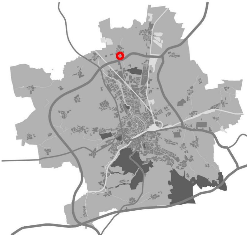
Schemakarte zur Lage im Stadtgebiet

Das Plangebiet der FNP-Änderung befindet sich im nördlichen Stadtgebiet von Erfurt im Ortsteil Mittelhausen. Die mittlere Entfernung zum Stadtzentrum/ Anger beträgt ca. 7 km. Die Fläche der FNP-Änderung umfasst ca. 2,9 ha.