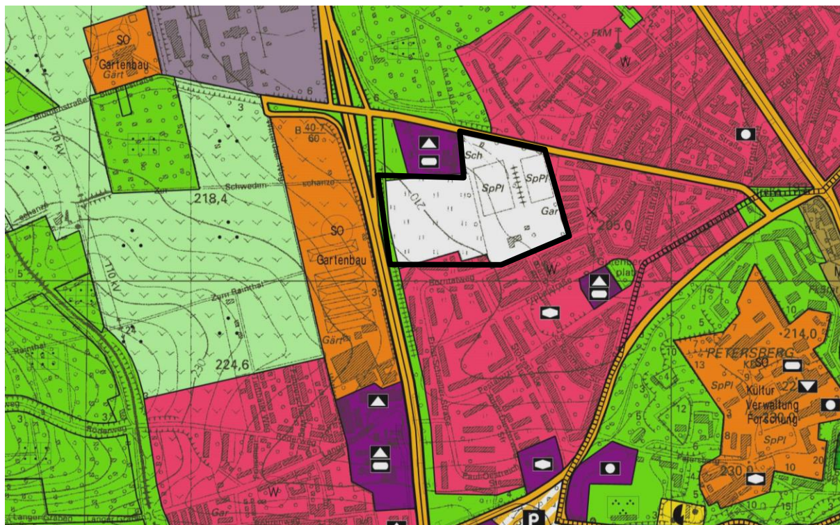
Auszug wirksamer Flächennutzungsplan der Stadt Erfurt, M 1:10.000, Stand 27.05.2006

Die Grundkonzeption des wirksamen FNP enthält eine Entwicklungspriorität für Bauflächen an „Entwicklungachsen“ zur Stabilisierung der vorhandenen Infrastrukturen. Das Plangebiet liegt im südlichen Teilbereich der Entwicklungsachse Nord (West). Diese Achse gehört durch die dicht besiedelten Bereiche der Andreasvorstadt zu den Siedlungsschwerpunkten der Stadt Erfurt.