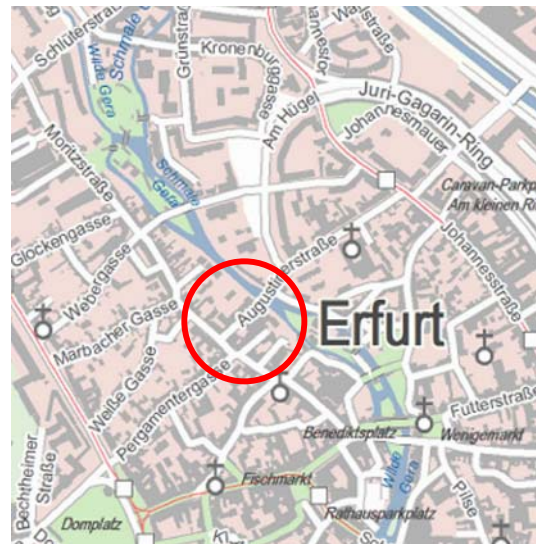
Übersichtskarte zum Plangebiet