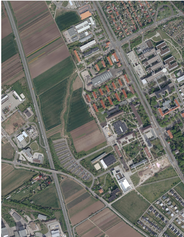
Abbildung: Luftbild aus dem Jahr 2014 für den Standort Universität