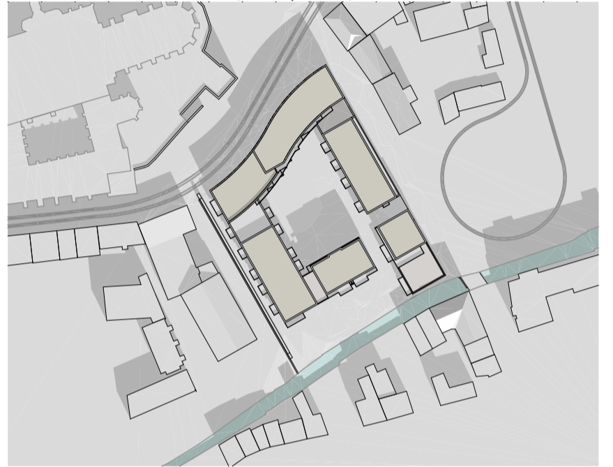
21.März/ 21. September; 12.00 Uhr