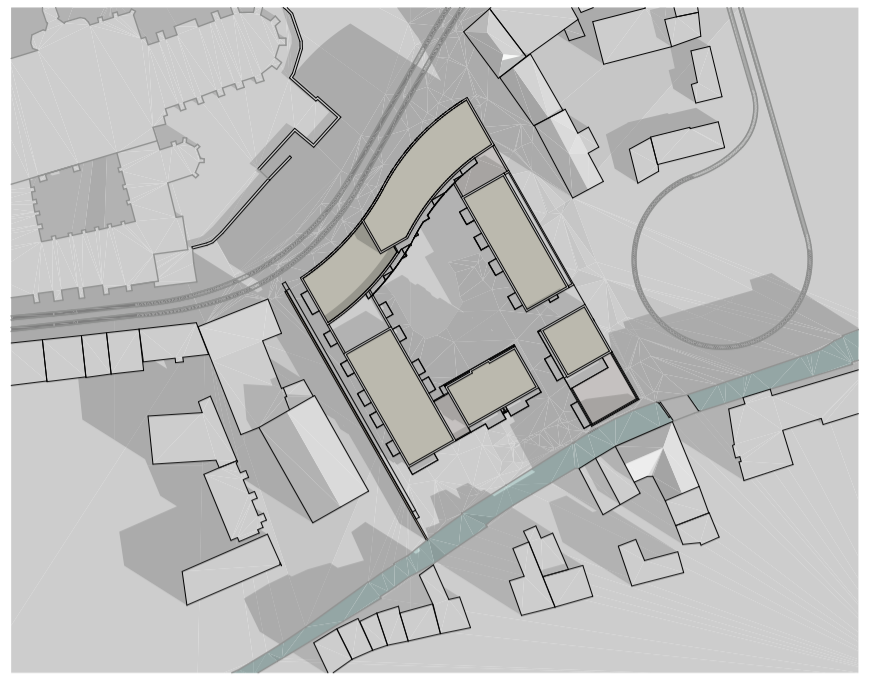
21.März/ 21. September; 10.00 Uhr