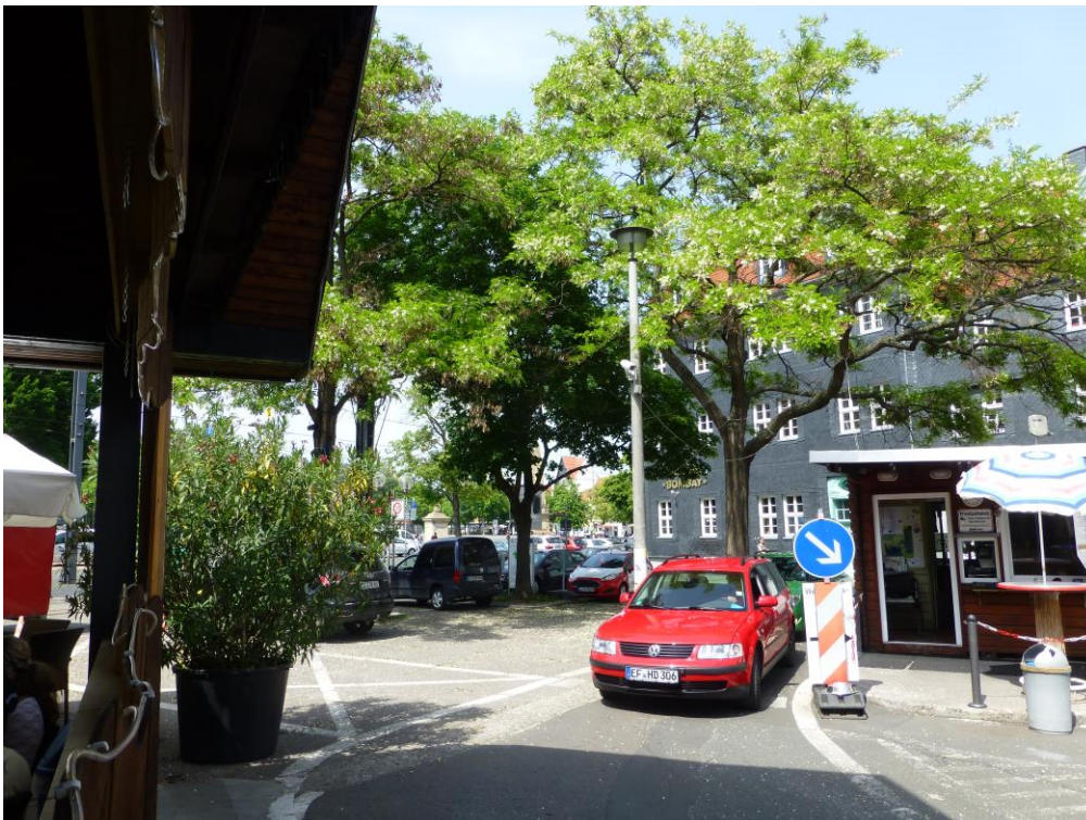
Abb 5: Eine Robiniengruppe im nördlichen Zipfel des Geländes stellt den einzigen Bewuchs auf der beplanten Fläche dar (22. Mai 2014)