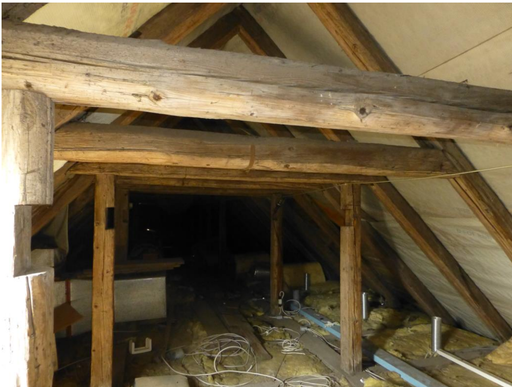
Abb 7: Im Spitzdachboden fanden sich keine Hinweise auf Ansiedlungen durch Fledermäuse (22. Mai 2014)