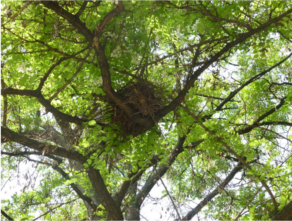
Abb 6: Besetztes Ringeltaubennest in Robinie innerhalb des Planungsraumes (22. Mai 2014)