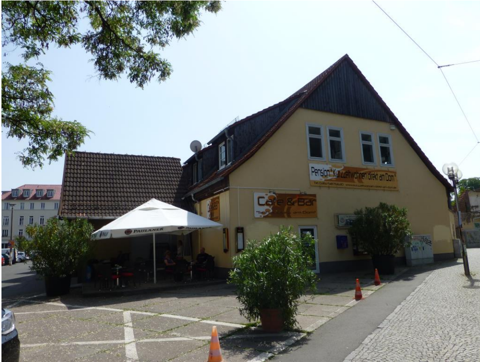
Abb 2: Straßenseitige Ansicht des vorhandenen genutzten Gebäudes (22. Mai 2014)