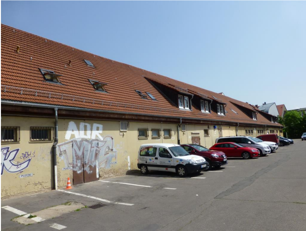
Abb 4: Die westliche Gebäudefront mit benachbarten Parkflächen, der Dachstuhl ist z.T. ausgebaut und bewohnt (22. Mai 2014)