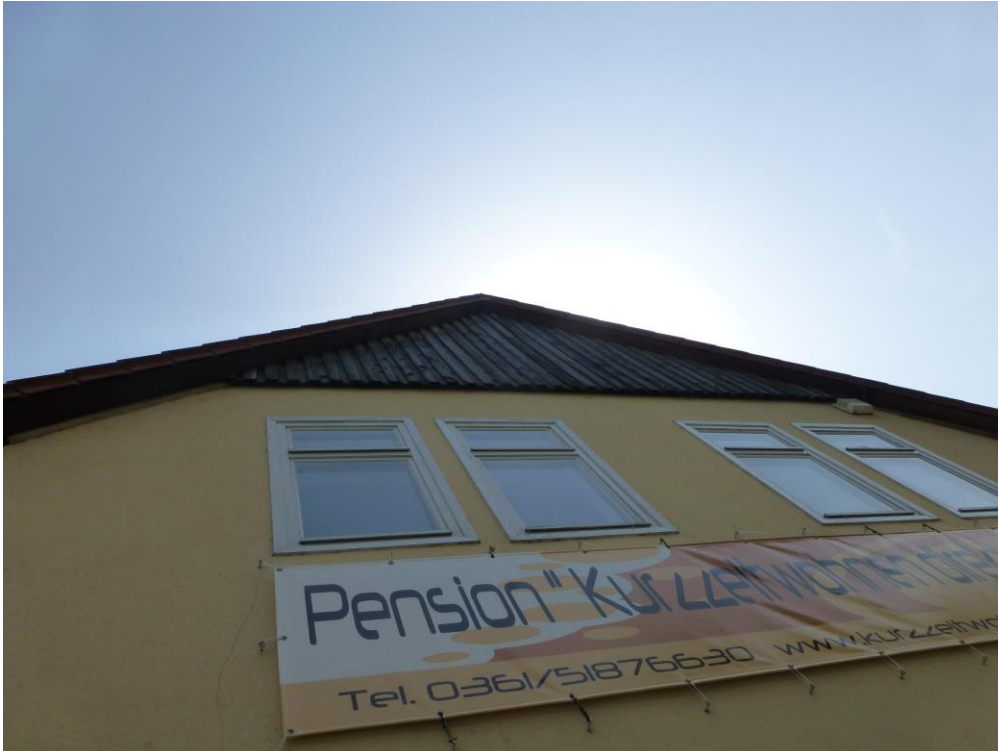
Abb 3: Die nördliche Gebäudeseite weist eine Holzverkleidung auf, welche als Quartier für Fledermäuse geeignet ist (22. Mai 2014)