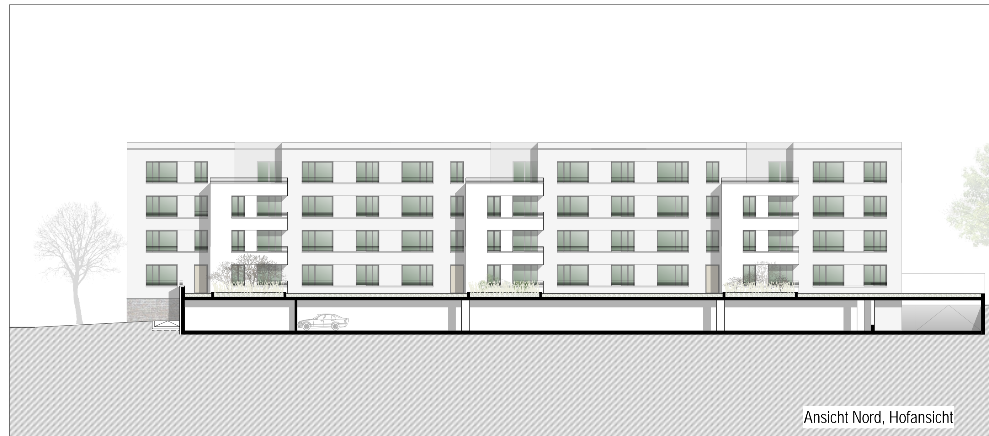
Ansicht Nord, Hofansicht