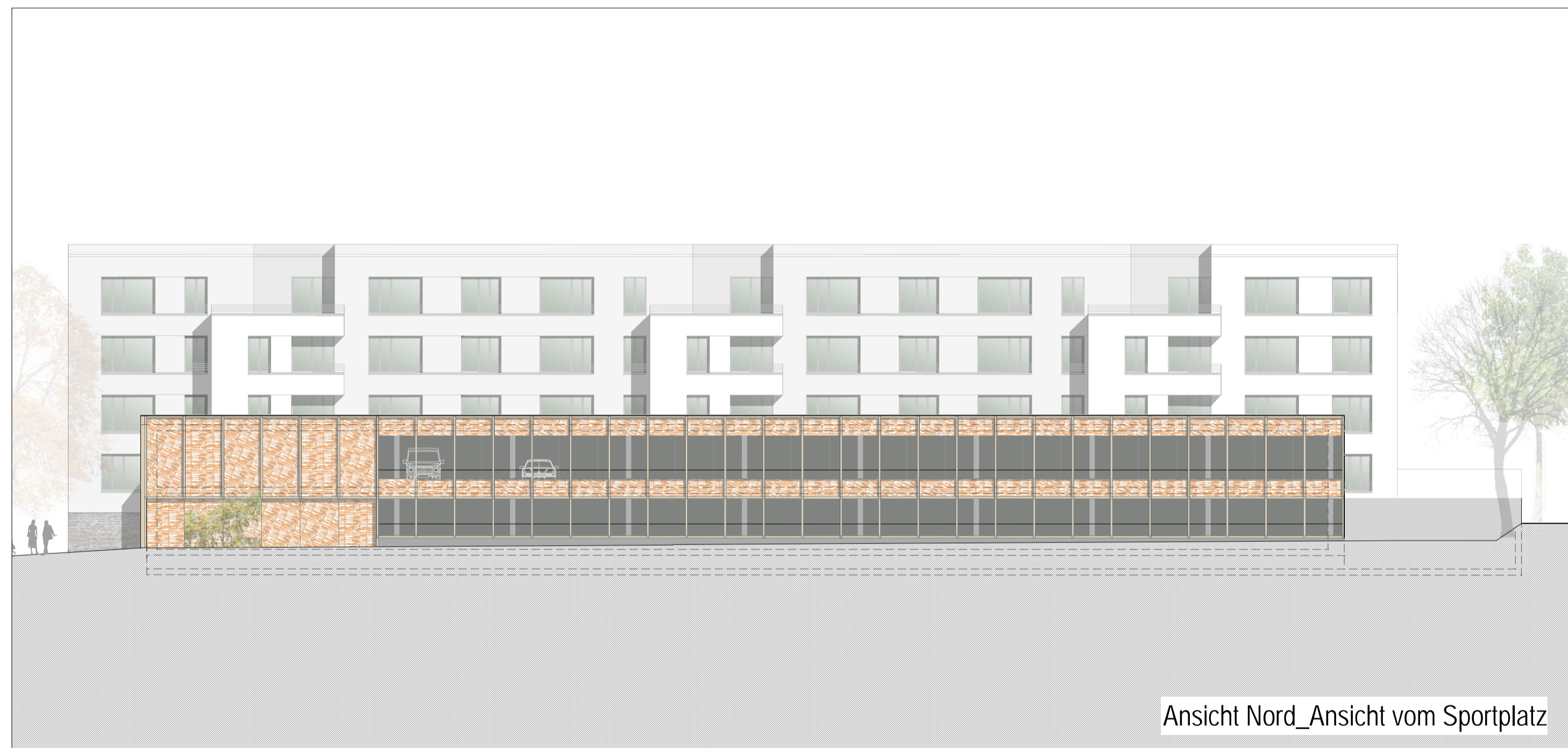
Ansicht Nord_Ansicht vom Sportplatz