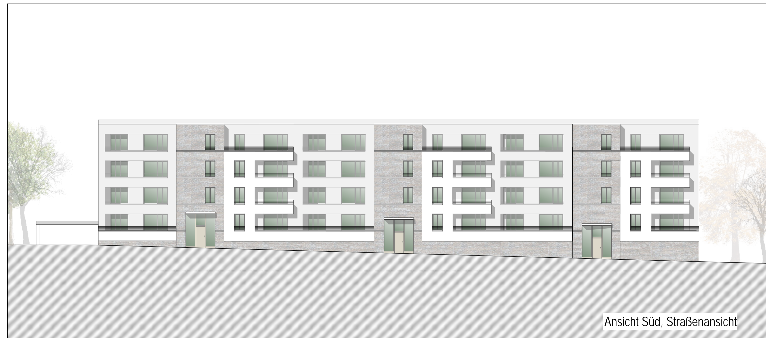
Ansicht Süd, Straßenansicht