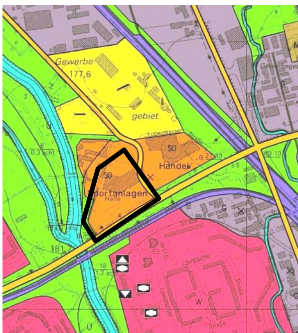
Auszug wirksamer FNP (Veröffentlichung im Amtsblatt vom 27.05.2006) mit Bereich der FNP-Berichtigung Nr. 9

Das neue städtebauliche Entwicklungsziel für das Plangebiet ist ein Sondergebiet Sportanlagen / Handel - nicht zentrenrelevant. Die geordnete städtebauliche Entwicklung des Gemeindegebietes wird dabei gewahrt.