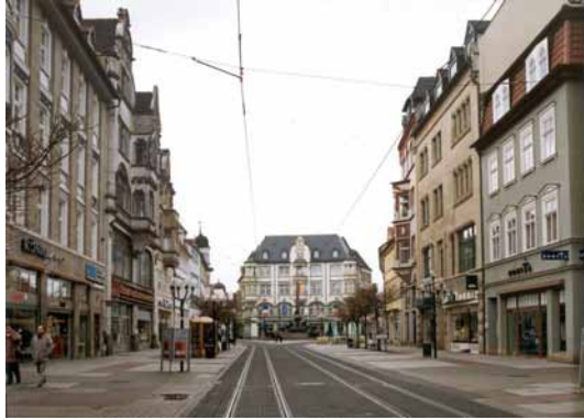
2000 Anger Süd Die Farbvielfalt im Stadtboden erzeugt ein unruhiges Raumbild.