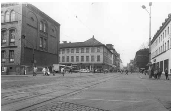
1991 Bahnhofstraße / Kreuzung Juri-Gagarin-Ring