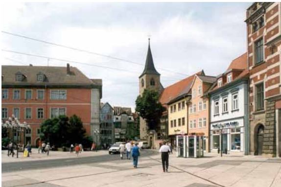
1995 Blick in Richtung Schlösserstraße Die Gestaltung des Stadtbodens und die Anordnung der Telefonzellen folgt keinem raumgestalterischen Ziel.