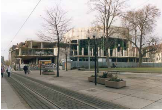
1993 Hirschgarten Blick von der Neuwerkstraße auf die Bauruine.