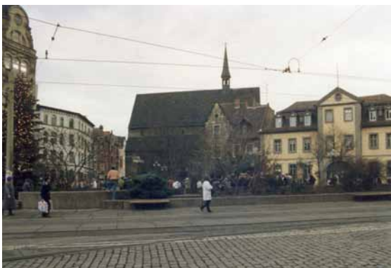
1991 Blick auf Ursulinenkloster und Barockgebäude "Zur grünen Aue und zum Kardinal" Raumbeherrschende Hochbeete schränken den freien Blick und die Nutzung des Platzes ein.