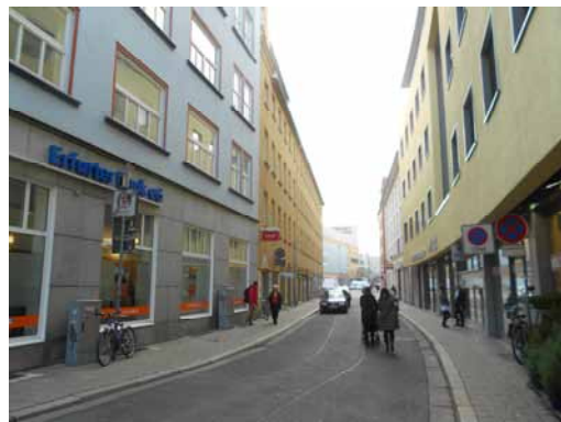
2013 Hirschlachufer - Blick von der Bahnhofstraße Raumreparatur durch Neubebauung und die Sanierung der Straße bilden den Rahmen für modern Nutzungen.