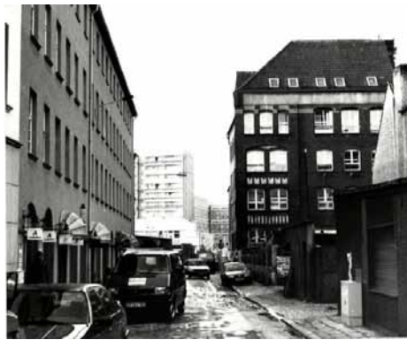
1990 Hirschlachufer - Blick von der Bahnhofstraße