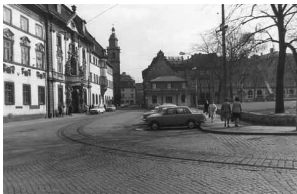
1986/87 Regierungsstraße - Blick auf die Staatskanzlei Freiflächengestaltung zugunsten des Verkehrs.