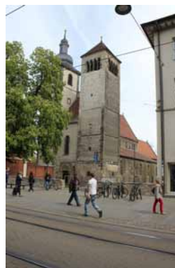
2014 Das Umfeld der Kirche wurde neu gestaltet und bietet nun Platz für Aufenthalt und Erholung. Der neu angelegte Radweg entschärft die Konflikte mit Fußgängern und Stadtbahn in der Fußgängerzone.