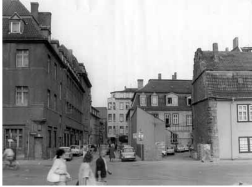
1991 Lachsgasse / Kreuzung Hirschlachufer