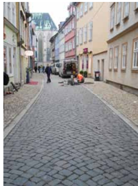
2013 Weitergasse Materialverwendung und Gliederung des Stadtbodens nach historischem Vorbild.