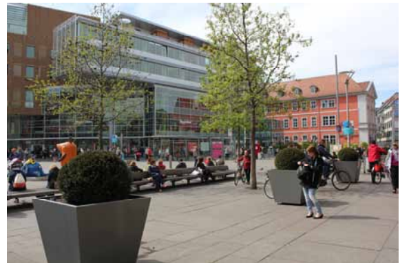
2014 Platz mit hohem gestalterischen Anspruch und Aufenthaltsqualität.