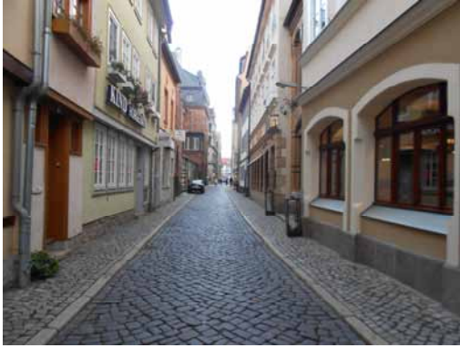
2013 Grafengasse Die Neugestaltung und Sanierung des Stadtbodens ist hier nicht erforderlich.