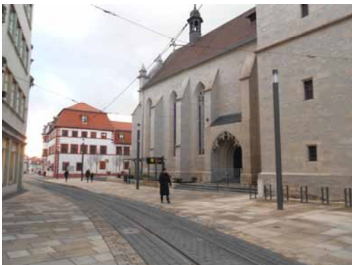
2013 Regierungsstraße - Blick auf Wigbertikirche und Staatskanzlei im Hintergrund. Der neu gestaltete Straßenraum mit neuer niederflurgerechter Stadtbahnhaltestelle.