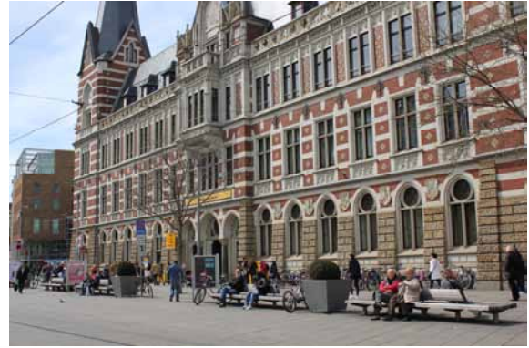
2014 Die Architektur dominiert den Platz. Großzügige Bänke und Pflanzkübel mit Gehölzpflanzungen markieren die Aufenthaltszone.