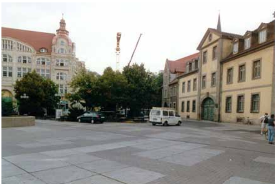
2000 Anger Nord Einbauten und Fahrzeuge dominieren den Platz. Betonplatten und -pflaster folgen keinem Verlegemuster.