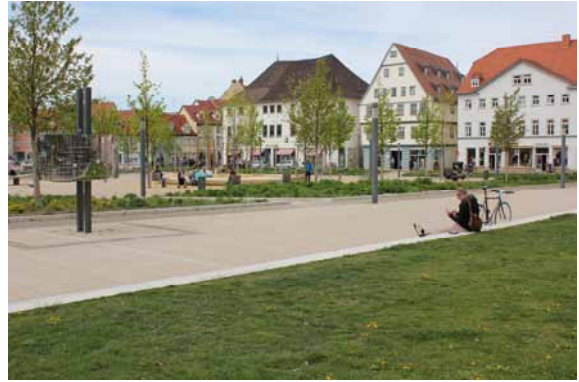
2014 Der Hirschgarten - Möglichkeiten für Aufenthalt, Erholung und Erlebnis im Innenstadtgebiet.