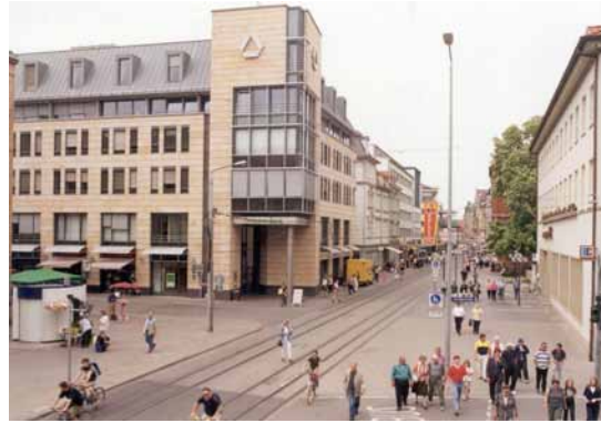
2000 Neubebauung Bahnhofstraße / Ecke Augustmauer