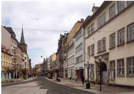
2000 Anger Süd Großformatige Betonplatten in farbeinheitlichen Beige- und Rottönen mit einer in der Altstadt nicht gewünschten Ebenheit.