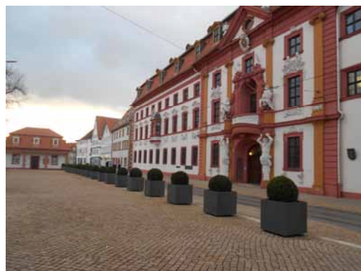
2013 Regierungsstraße - Blick auf die Staatskanzlei Verkehrsberuhigung und Gestaltung dienen dem Anspruch an Aufenthaltsqualität und Repräsentation.