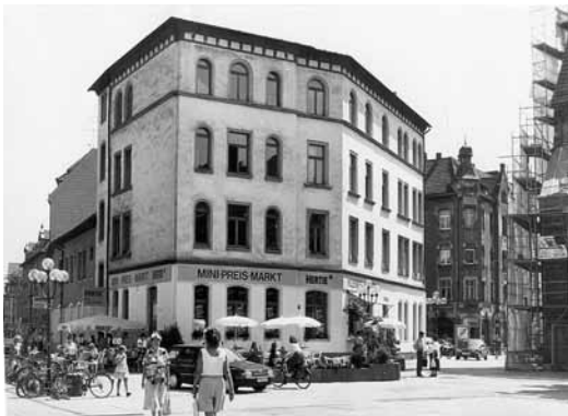
1994 Anger 2