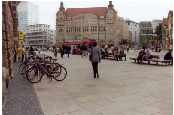
2002 Blick auf Anger 1 Mobile Stadtgrünelemente und reduzierte raumverstellende Einbauten machen die ursprüngliche urbane Raumwirkung wieder erlebbar.