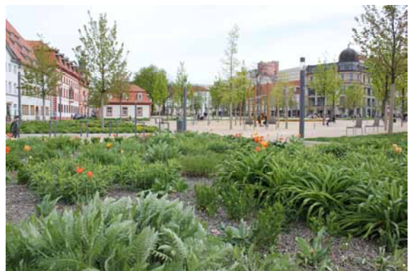
2014 Der Hirschgarten - grüne Oase in der Altstadt.