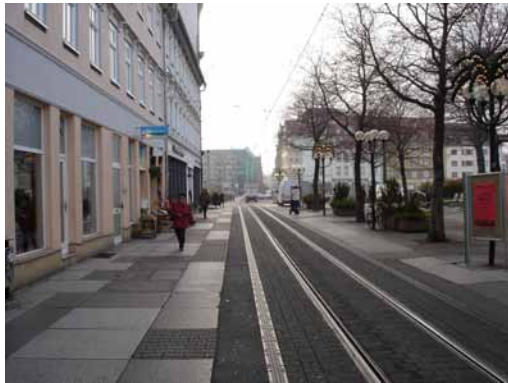
2006 Neuwerkstraße Vor der Neugestaltung der Freiflächen.