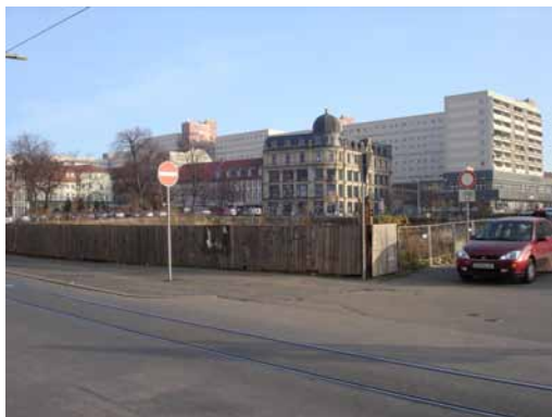
2006 Hirschgarten - Blick von der Regierungsstraße Brachfläche nach Abbruch der Bauruine.