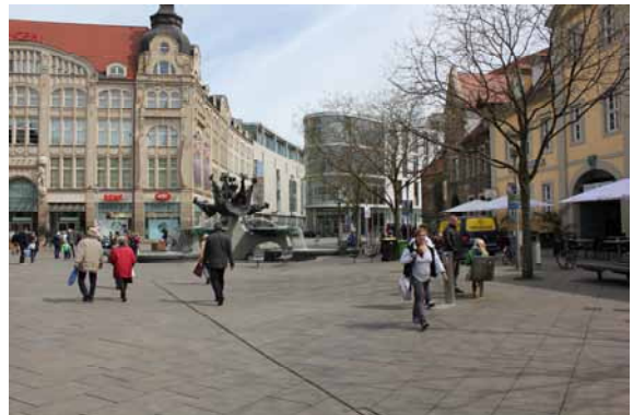
2014 Die Gestaltung des Angers würdigt die Architektur. Die bewusst zurückhaltende Ausstattung folgt den Nutzungen und Anforderungen.