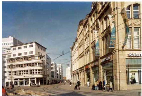
2002 Bebauung des brachgefallenen Quartiers.