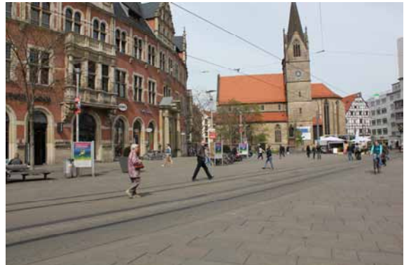
2014 Die Fußgängerzone wurde bis zur Kaufmannskirche erweitert. Mit der Neugestaltung des Platzes erhält die Kirche ein repräsentatives Umfeld.