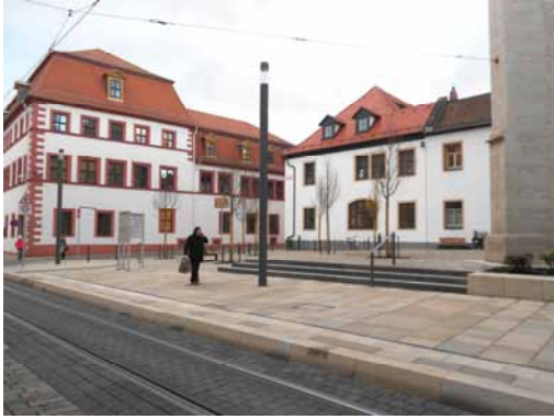
2013 Regierungsstraße - Platz vor der Wigbertikirche Aufenthaltsqualität und Repräsentationswille mit hohem gestalterischen Anspruch.