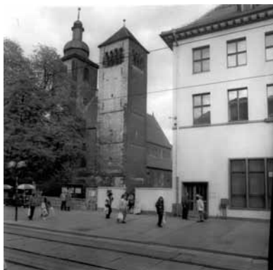
1991 Blick auf die Reglerkirche in der Bahnhofstraße.