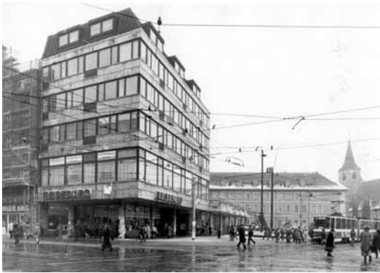
1994 Angereck / Schlösserschule Wettbewerbsergebnis aus dem Jahr 1979