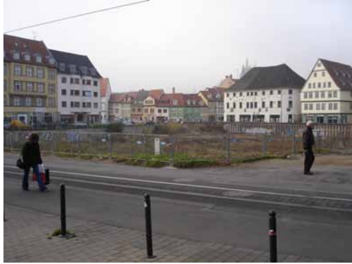
2006 - Blick von der Neuwerkstraße Hirschgarten - Blick von der Neuwerkstraße Brachfläche nach Abbruch der Bauruine.