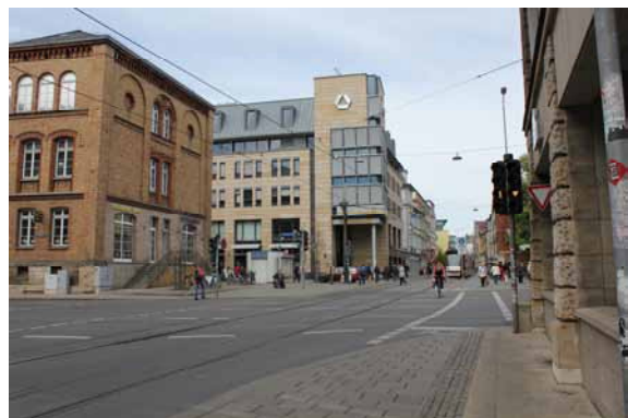
2014 Bahnhofstraße / Kreuzung Juri-Gagarin-Ring