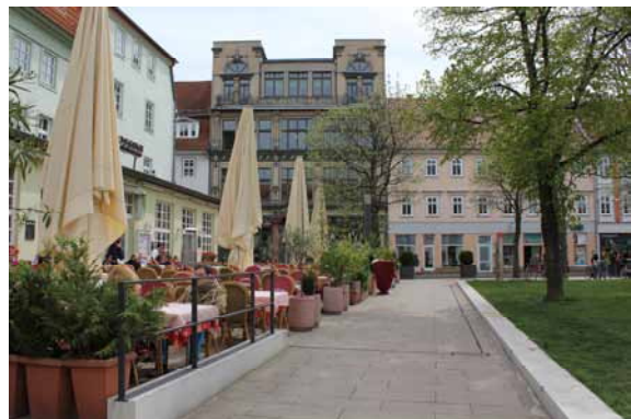
2014 Hirschgarten Blick von der Regierungsstraße Eine klare Zonierung schafft Übersichtlichkeit und Raumqualitäten. Außenbestuhlungen beleben den Platz.