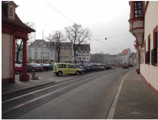
2006 Regierungsstraße - Blick auf den Hirschgarten Teile des Hirschgartens dienen als Parkfläche vor der Staatskanzlei.