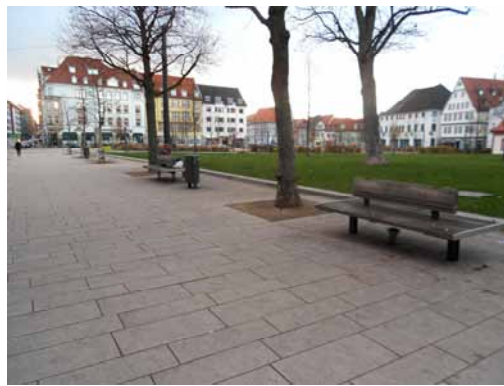
2013 Regierungsstraße / Hirschgarten Zurückhaltung in der modernen Ausstattung.