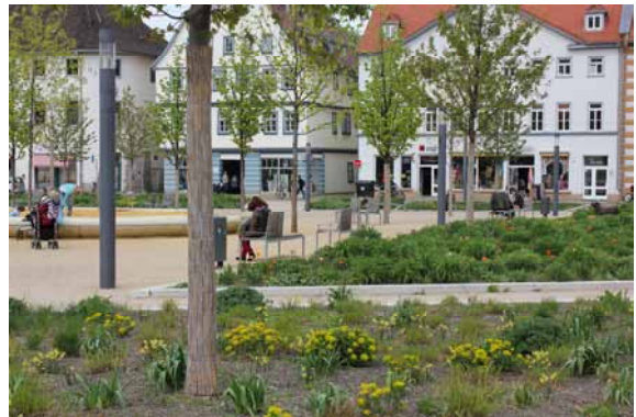
2014 Der Hirschgarten mindert das Freiraumdefizit und bietet farbige Schmuckpflanzungen im jahreszeitlichen Wechsel.