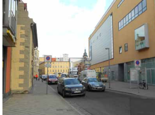
2013 Hirschlachufer - Blick aus Ecke Lachsgasse Neubau Geschäfts- und Parkhaus 'F1'