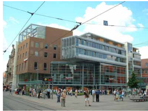
2004 Angereck / Schlösserschule Wettbewerbsergebnis aus dem Jahr 2000