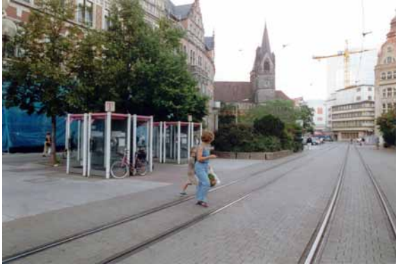
2000 Anger Nord vor dem Hauptpostamt Raumverstellende Ausstattung und Einbauten mit wenig Aufenthalts- und Raumqualität.