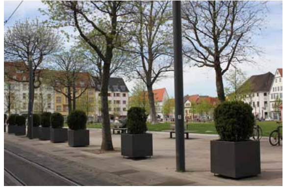
2014 Hirschgarten Blick von der Neuwerkstraße Anspruchsvolle Einbindung des 'Stadtgartens'.