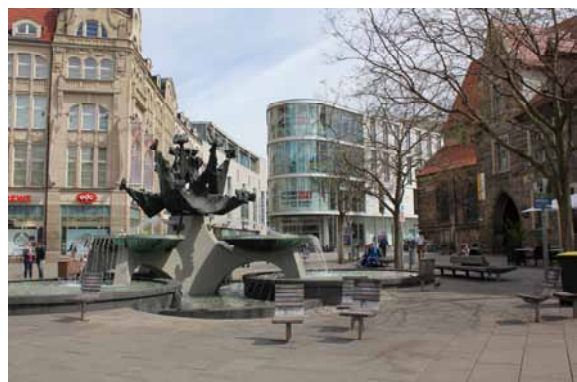
2014 Moderne Wasserbecken und Ausstattungselemente beleben den Platz. Das Begrünungskonzept respektiert die Architektur und die Multifunktionalität des Platzes.