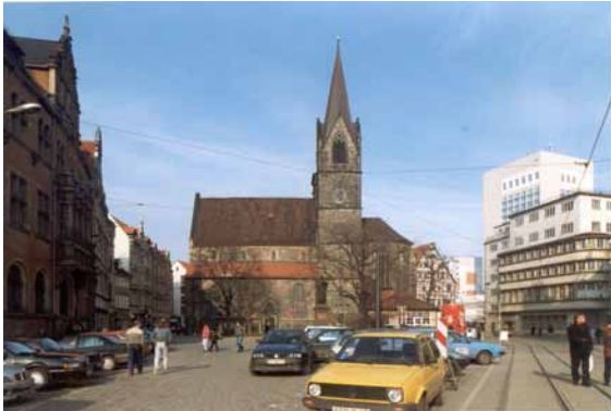
1999 Blick auf die Kaufmannskirche Der Bereich um die Kirche ist Verkehrsfläche und Parkplatz.