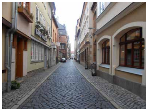
2013 Durch umfassende Sicherungs- und Sanierungsmaßnahmen konnte der wertvolle Gebäudebestand in der Grafengasse erhalten werden.