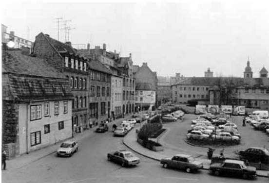
1991 Hirschlachufer / Ecke Lachsgasse