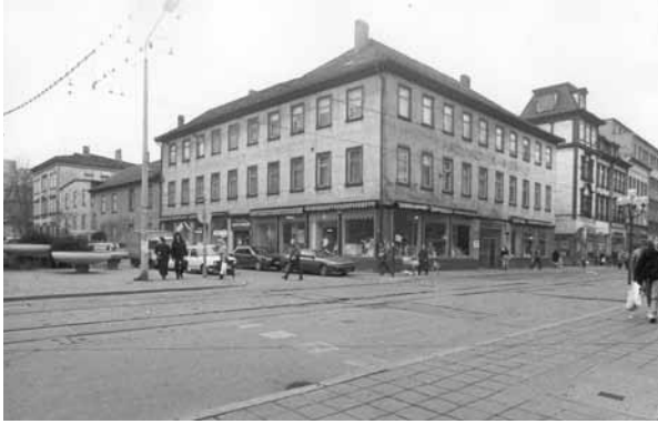
1991 Bahnhofstraße / Ecke Gartenstraße