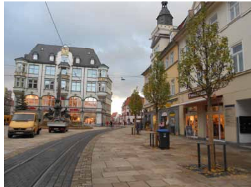
2013 Anger Süd, Blick auf das ehem. Kaufhaus Merkur Lauffreundliche großformatige Natursteinplatten mit hohem gestalterischen Anspruch.