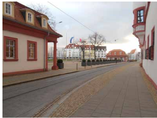
2013 Der Hirschgarten bekommt seine ursprüngliche Fläche zurück.