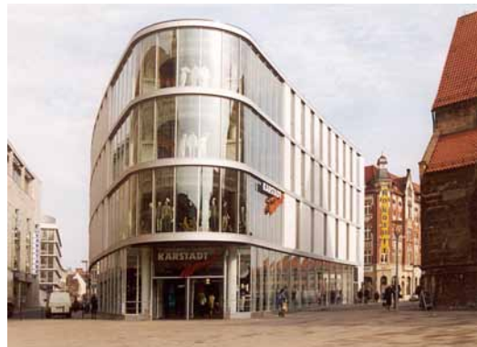
2002 Neubauung des Quartiers