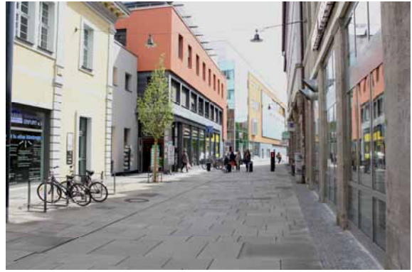
2014 Lachsgasse - Blick vom Anger Richtung Hirschlachufer