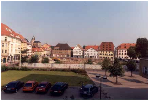
1999 Hirschgarten - Blick aus Richtung ehem. Löbertor Brachfläche nach Abbruch der Bauruine.