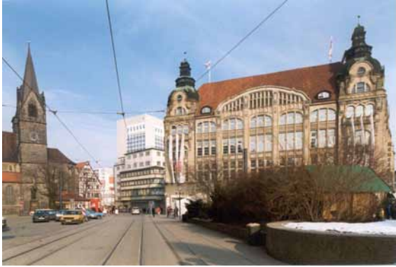
1999 Blick auf Anger 1 Hochbeete trennen Verkehrs- und Aufenthaltsflächen voneinander ab.