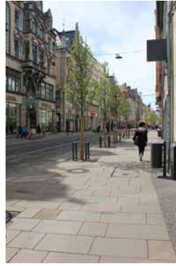
2014 Einheitliche Stadtbodengestaltung und Zurückhaltung in der Ausstattung schaffen eine ruhige Raumwirkung.