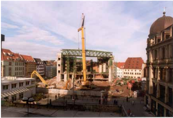
1996 Hirschgarten - Blick aus Richtung Löbertor Abbruch der Bauruine.