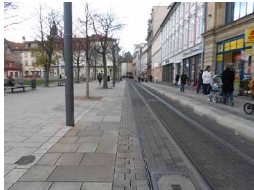
2013 Neuwerkstraße Neue niederflurgerechte Stadtbahnhaltestelle.