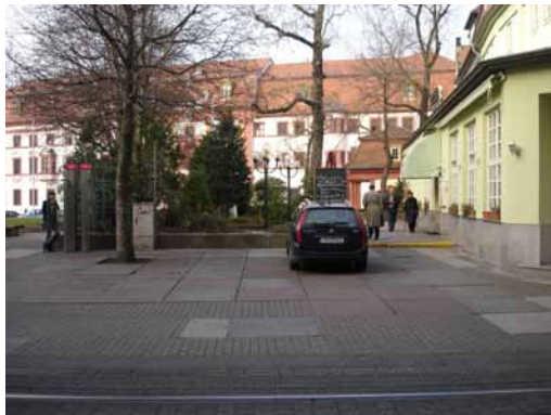
2006 Hirschgarten Blick von der Neuwerkstraße auf die Thüringer Staatskanzlei Raumbeherrschende Pflanzungen verunklären den Raum.