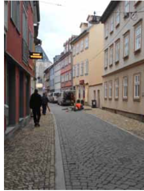
2013 Die nach historischem Vorbild sanierte Weitergasse ermöglicht Wohnen, Gastronomie und Gewerbe in attraktiver historischer Atmosphäre.