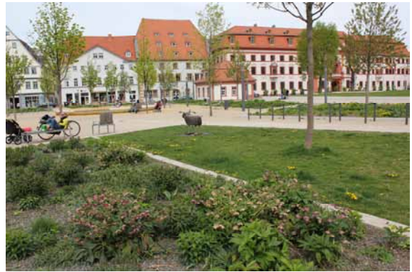
2014 Der Hirschgarten - neugewonnener Freiraum in der Altstadt.