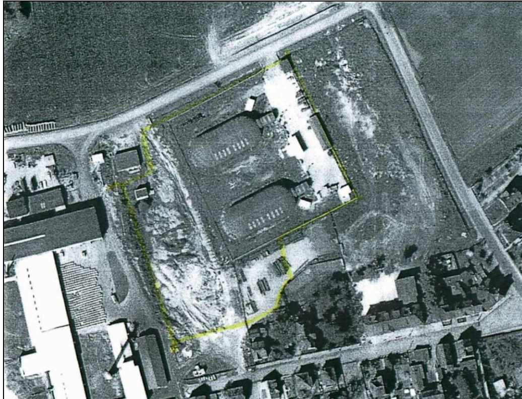
Luftaufnahme 1981 mit den zwei Tragflughallen, die vom Gothaer VEB Schuhkombinat „Paul Schäfer“ als Lager für Material zur Herstellung von Schuhen genutzt wurden.