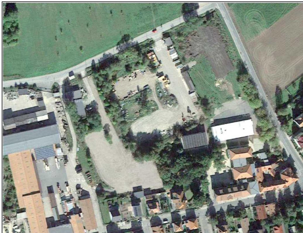
Luftaufnahme 2013: Die Flächen wurden bereits überwiegend entsiegelt, die Baustelleneinrichtung der ICE-Trasse nimmt noch viel Raum ein.