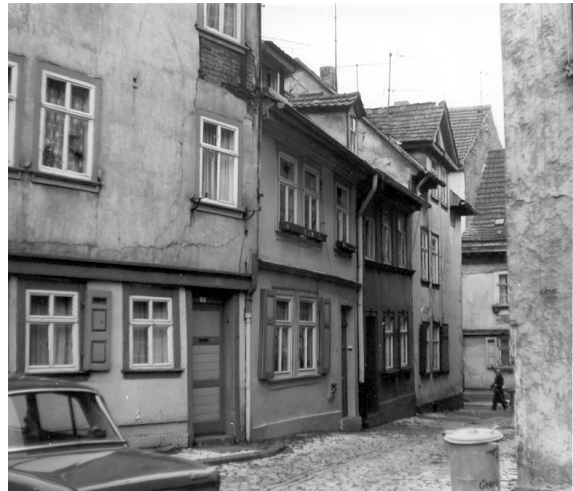
Foto 3 um 1990, Weisse Gasse