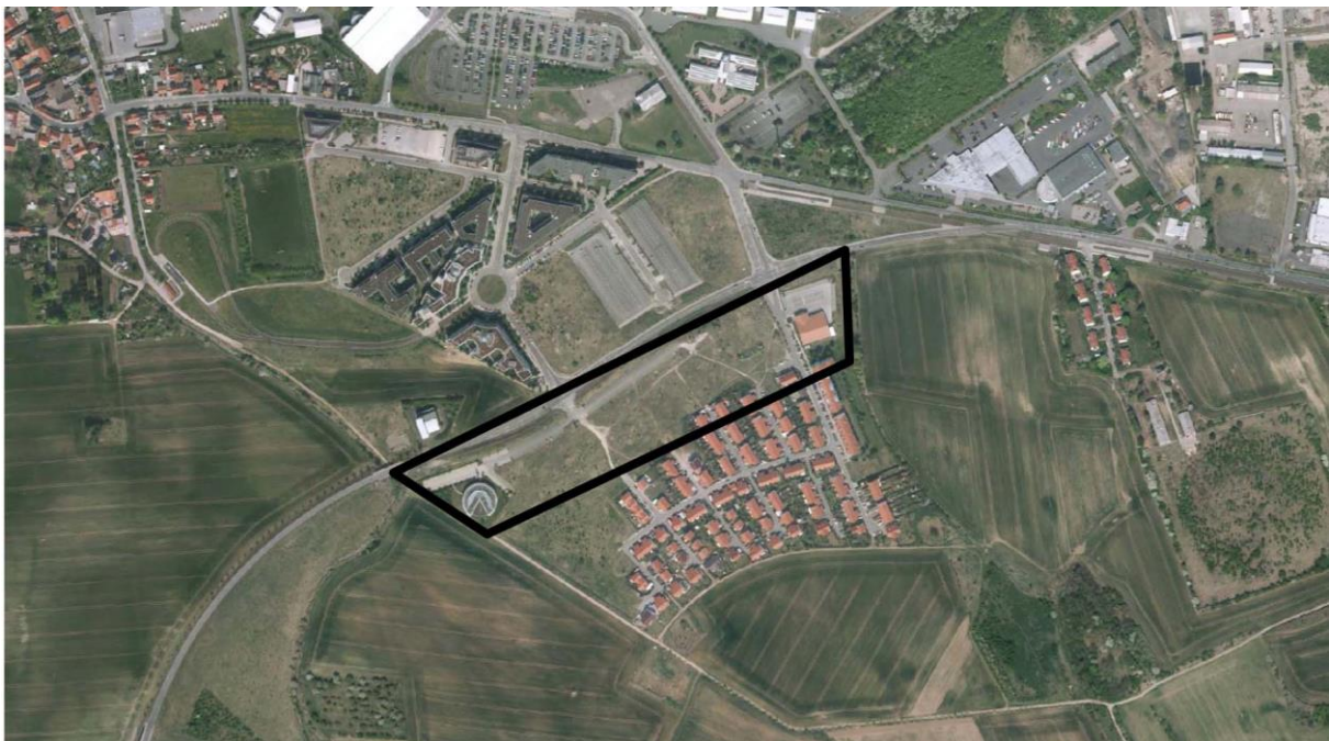
Stand:22. April 2011