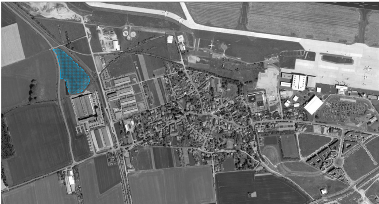
Abb.: Übersichtslageplan

Die Flurstücke 563/114 und 749/115 in Erfurt- Bindersleben sollen mit einem Neubau eines Druckereigebäudes der Funkemedien Gruppe bebaut werden.