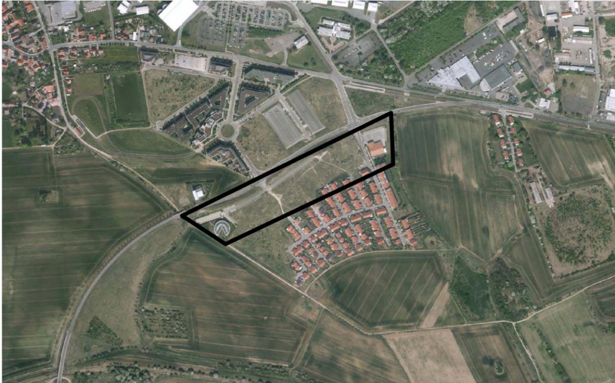
Quelle Luftbild: Amt für Geoinformation und Bodenordnung, Stand:22. April 2011

Sowohl vom internationalen Verkehrsflughafen "Erfurt-Weimar" wie auch von der Hersfelder Straße gehen für das Plangebiet relevante Verkehrslärmemissionen aus.